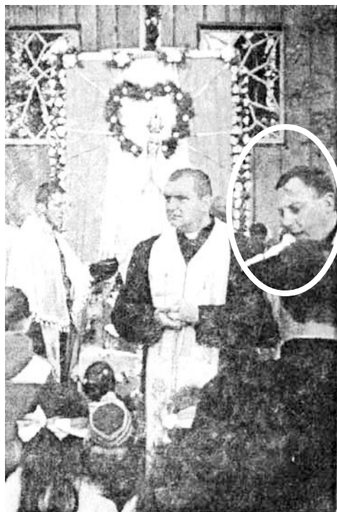
Світлина з газети українських лефевристів «Греко-Католицька Традиція», № 23, 6-19 листопада 2005 року.