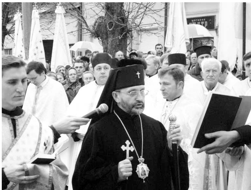
Всечесніші і преподобні отці, сестри і брати, достойні учасники моління!

Бажаю подякувати вам за ваше розуміння та вашу участь у цьому молінні. Звичайно, ми могли спокійно молитися з вами у наших храмах, але ми прибули сюди, щоб стояти під відкритим небом і молитися так, як ми молилися у 1988-89 роках під час виходу Церкви з укріття. Чому виникла потреба молитовного походу, прощі й ревного моління на майдані? Чому ми з вами так чисельно зібралися із нашої Львівської Архиепархії? Яка потреба цього? А потреба у цьому велика, оскільки в ряди нашої Церкви вдираються люди, котрі, прикриваючись нашими церковними одягами та згадуванням на Богослужіннях імен Святішого Отця та Блаженнішого Патріарха Любомира, чинять розкол в УГКЦ. Не бажаю на це посвячувати багато часу у моєму слові до вас, але бажаю перестерегти вас, щоб не «зводили вас марними словами» (Єфес. 5,6). На території нашої й інших епархій з'являються священники, котрі виконують вказівки схизматських єпископів з-за кордону.