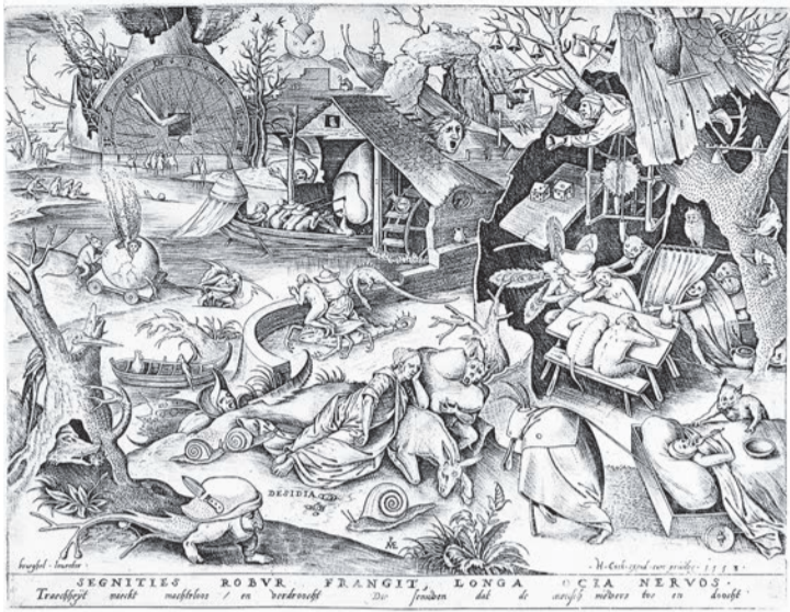
Гравюра «Лінивство» фламандський художник Пітер Брейгель (1525-1569)

Щодо того, що таке лінивство, є багато фальшивих уявлень. Лінивство як головний гріх не означає бездіяльності. Навпаки, воно може бути дуже активним, може приховуватися за великою працьовитістю. Але воно є бездіяльністю в тому, в чому людина повинна бути діяльною, тобто в найглибшій течії свого покликання – віддавання життя за тих, кого мені доручив Бог.