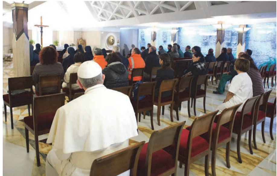
На фото: Папа Франциск перед початком ранкової проповіді у «Домі св. Марти»