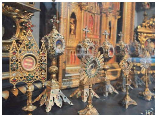
На фото: каплиця Святого Антонія в Піттсбурзі, штат Пенсільванія має найбільшу колекцію реліквій за межами Риму.

У місті Піттсбург (штат Пенсільванія, США) в каплиці св. Антонія зібрана друга за значимістю в світі після римської колекція реліквій та мощів святих.