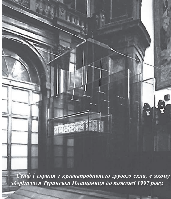
Сейф і скриня з куленепробивного грубого скла, в якому зберігалася Туринська Плащаниця до пожежі 1997 року.

Трематоре, який, ризикуючи життям, врятував Плащаницю, розповідав, що в момент розбивання молотком куленепробивної капсули думав лише про те, що цю реліквію може врятувати тільки він. Казав, що чув всередині себе голос Бога, який додав йому