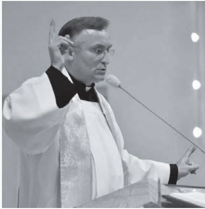
(Продовження, початок у «Меті» № 7/116 за вересень 2015 р.)