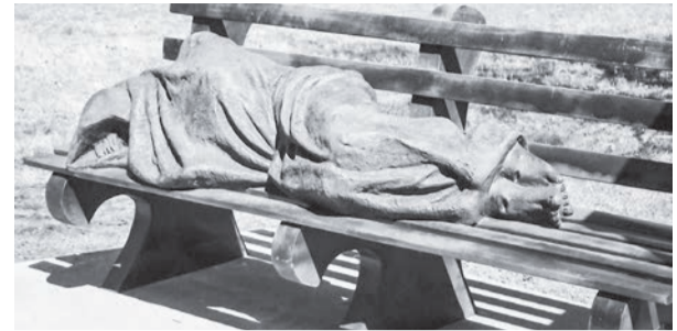
Нова робота відомого скульптора Тімоті Шмальца встановлена біля храму у місті Девітсон, (Північна Кароліна, США) зображує Ісуса Христа як безхатченка, який спить, загорнувшись у ковдру, на лавці в парку.

Бути християнином – це більше, ніж просто стверджувати це словами. Це те, чим ви живете і ділитеся з іншими!