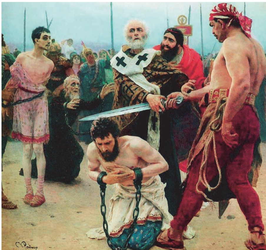
Св. Миколай Мирлікійський позбавляє від смерті трьох невинно засуджених. Худ. І. Ю. Ретін, 1888 р.