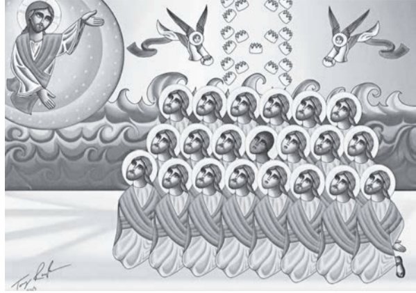
Ікона на честь Лівійських мучеників

Будівництво церкви на честь Лівійських мучеників – 21 копта, убитого джихадистами в Лівії в лютому цього року, почалося в єгипетському селищі Саламут, повідомляє 316NEWS. Вартість будівництва оцінюється в 1,3 млн. доларів, і половина цієї суми вже зібрана. Єгипетські християни вітають рішення президента країни Абдель Фаттаха Ас-Сісі побудувати цей храм в Саламуті – селищі, звідки були родом більшість мучеників.