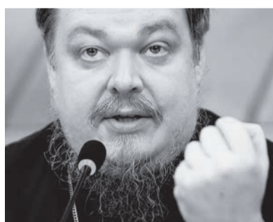
На фото: протоієрей РПЦ МП Всеволод Чаплін

тійської церкви, єпископ Ільяс Тума заявив у відповідь на це висловлювання: «Не може бути в християнстві ніякої священної війни! Незалежно від того, згоден хтось із цим, чи ні». Ще один сирійський священник – Іспіридон Танус – заявив в інтерв'ю прихильному до опозиції веб-сайту Suriyat, що Росія грається з вогнем: «Мученики в нашій Церкві не стануть мучениками війни; вони – жертви війни».