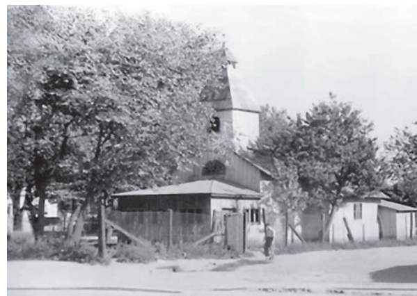
Такою запам'яталася церква на Богданівці у Львові. Вид з вулиці Городецької. Початок 60-х років ХХ ст.