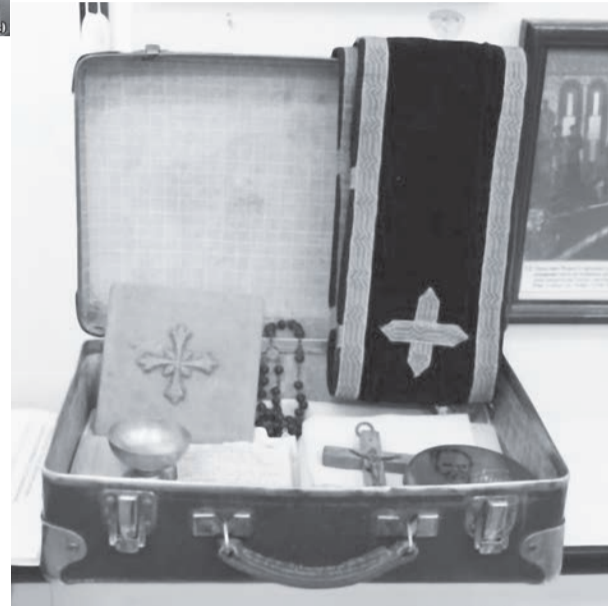
Типова валізка отця-підпільника. З такими священниками ходили на підпільні відправи.