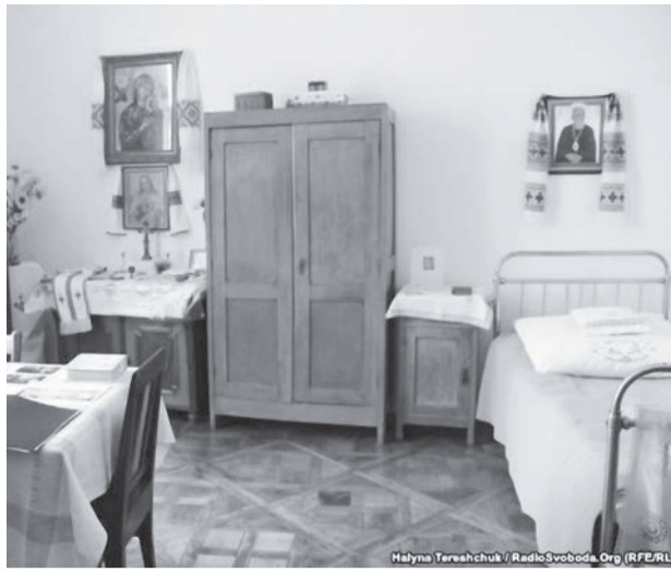
Кімната єпископа Василя Величковського, в якій висвячено понад 30 священників УГКЦ

У маленькій однокімнатній квартирі в самому центрі Львова (площа Соборна, 11, кв.3) від 1955 року діяла таємна церква. Її організував отець, майбутній підпільний владика Василь Всеволод Величковський, якого називали «батьком підпілля». Тут збережена атмосфера, інтер'єр, численні речі з часів підпілля: вітвар, ікони, ліжка, шафа, книжки, апарат, за допомогою якого виготовляли образки і молитовники. Спершу їх фотографували, а потім відтворювали на фотопапері. Келих служив чашею, а маленька тарілка – диском, які використовувались для Божественної Літургії. Літургійний посуд ховали під дошку підлоги, в одязі, за пічкою, бо їх під час обшуку могли вилучити. Престолом була тумба. Вітвар закривали, щоб