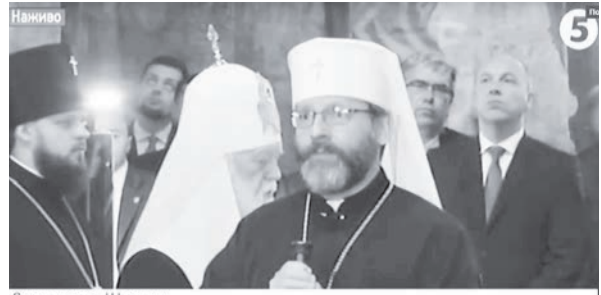
Святослав Шевчук Верховний архієпископ Києво-Галицької Української греко-католицької церкви Київ, Софійський собор

Онуфрій, Верховний Архiepіскоп Києво-Галицької Української Греко-Католицької Церкви Блаженніший Святослав, Ординарій Києво-Житомирської дієцезії Римо-Католицької Церкви єпископ Віталій Кривецький, Головний рабин Києва та України, Об'єднання єврейських релігійних організацій України Яков Дов Блайх, муфтії Духовного управління мусульман України Тамім Ахмед і старший єпископ «Союзу вільних Церков християн євангельської віри» України Василь Райчинець.