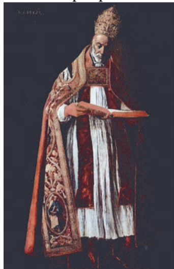
Папа Григорій I (?-590-12.III.604), худ. Ф. Сурбаран. (1598-1639)

64-й Папа Римський св. Григорій – визначний теолог, один із чотирьох «великих» латинських Отців Церкви (поряд зі св. Амвросієм, св. Августином і св. Єронімом). Серед численних реформ та досягнень його понтифікату – також реформа літургійного співу. Отож, григоріанським хоралом завдячуємо саме йому.