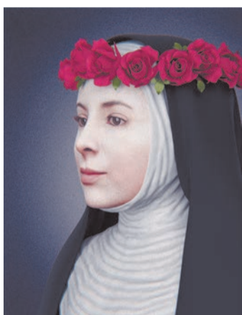
Свята Роза з Ліми (20.IV.1586-26.VIII.1617)

Свята Роза народилася в Перу. В дитинстві вона дуже страждала. З огляду на заборону матері, вона не могла вступити до монастиря, хоча й дуже цього прагнула. Свята Роза мешкала сама у саду батьківського дому; вона вирощувала квіти і лікарські трави та вишивала. Так Роза намагалася допомагати родині. Свята переживала глибокі містичні досвіди, писала чудові духовні гімни та виконувала їх, акомпануючи собі на гітарі.