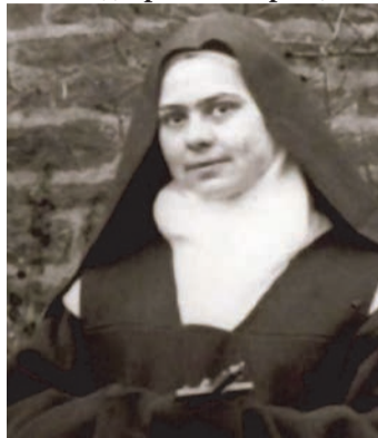
Свята Єлизавета від Пресвятої Трійці (18.VII.1880-9.XI.1906)

Єлизавета народилася 1880 року у Франції. Вже у віці 14 років вона склала приватний обіт чистоти та вирішила вступити до монастиря. Єлизавета була дуже здібною піаністкою, 1893 року навіть виграла національний конкурс у Франції. Мати святої погодилася на вступ доньки до монастиря тільки тоді, коли їй виповнився 21 рік. Святу Єлизавету називають духовною сестрою св. Терези від Дитятка Ісуса.