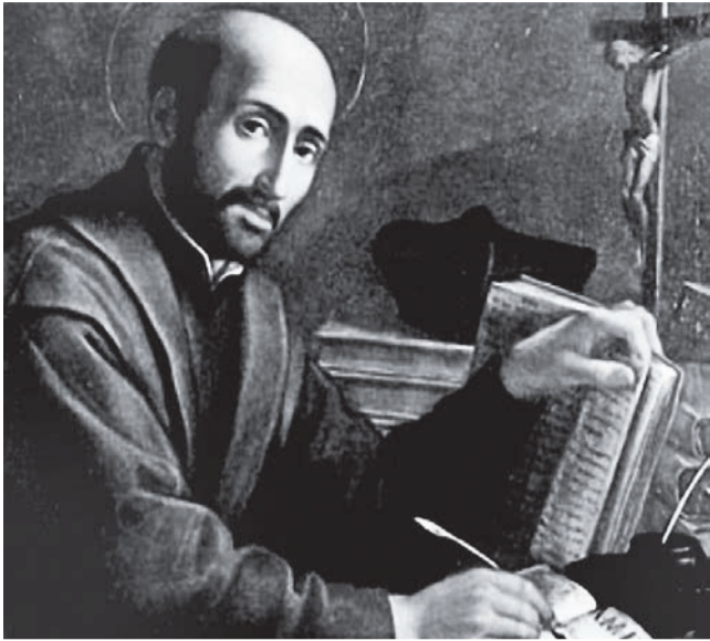
Святий Ігнатій Лойола (23.X.1491-31.VII.1556)

Кожного дня ми приймаємо безліч різних рішень – одні є менш важливі, забарвлені одновимірною буденністю, стосуються наших щоденних обов'язків, а інші, натомість, спонукають нас бути більш обережними та розсудливими, адже від прийняття цих рішень залежатиме наше майбутнє.