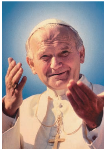
Святий Іван Павло II (10.V.1920-2.IV.2005)

Папа-слов'янин також любив співати. Він часто співав із паломниками з Польщі улюблені пісні рідною мовою, зокрема пісню «Barka».