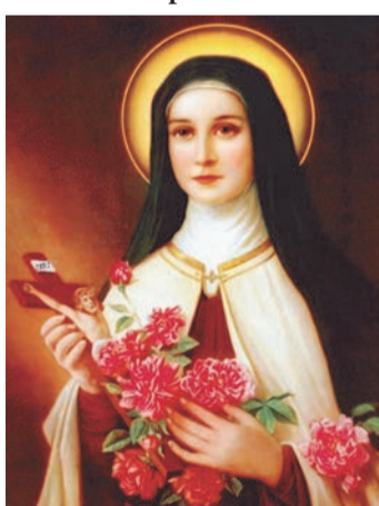
Свята Тереза Авільська (28.III.1515-4.X.1582)

Свята реформаторка Кармелю дуже любила музику й танці. Вона навіть придбала різноманітні музичні інструменти для монастиря Втілення, в якому