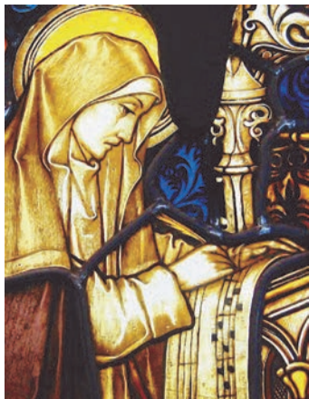
Гільдегарда Бінгенська (1098-1179)

Ця середньовічна свята – одна з найвизначніших постатей свого часу. Коло її зацікавлень було надзвичайно широким: це і філософія, і теологія, і медицина, і музика. Крім богословських