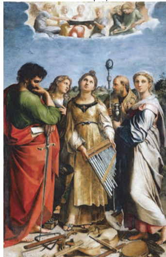
Св. Цецилія (200-230 рр), худ. Рафаель Санті, (1516 р.)

Церква шанує св. Цецилію, як діву і мученицю. Римлянка на ім'я Цецилія народилася на початку III століття і з дитинства відзначалася неймовірною красою. За легендою, дівчина грала на музичному інструменті, що нагадує сучасний орган. Свята Цецилія вважається покровителькою церковних хорів та органістів у Католицькій Церкві.