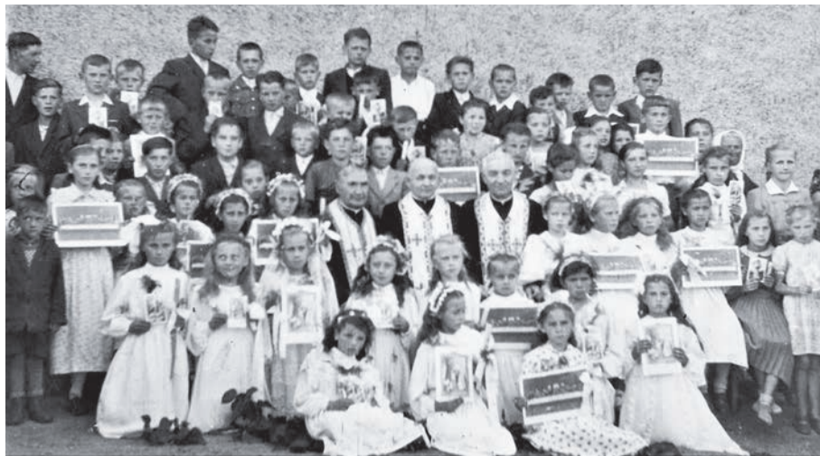
Святе Причасття у Хшанові. 1951 р.

із давніх класів отець облаштував каплицю, в якій вже 6 липня 1947 р. відправив першу Божественну Літургію для греко-католиків. Заснована отцем Ріпецьким у Хшанові станиця стала єдиною постійно діючою, й до неї приїжджали переселенці з найдалших місцевостей західної та північної Польщі. Категорично відмовився служити в латинському обряді. Перебував у постійному конфлікті з місцевим Вармінським ординаріатом та Примасом Стефаном Вишинським.