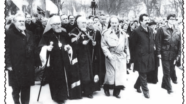
Повернення Блаженнішого Мирослава Івана Любачівського до Львова, 1991р.