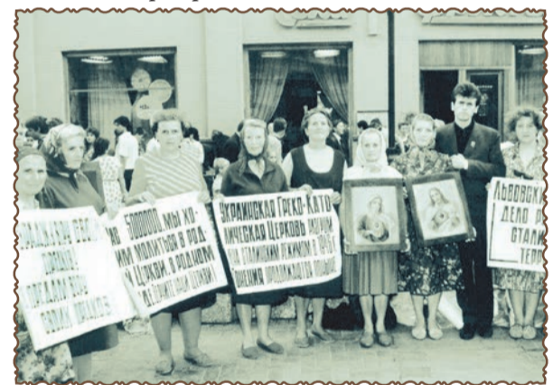
Москва. 1989 р. Група вірних УГКЦ проводить акцію у Москві, на Арбати.