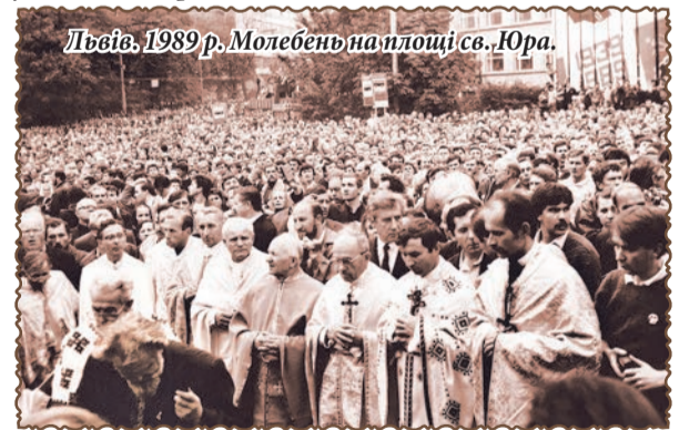
Львів. 1989 р. Молебень на площі св. Юра.