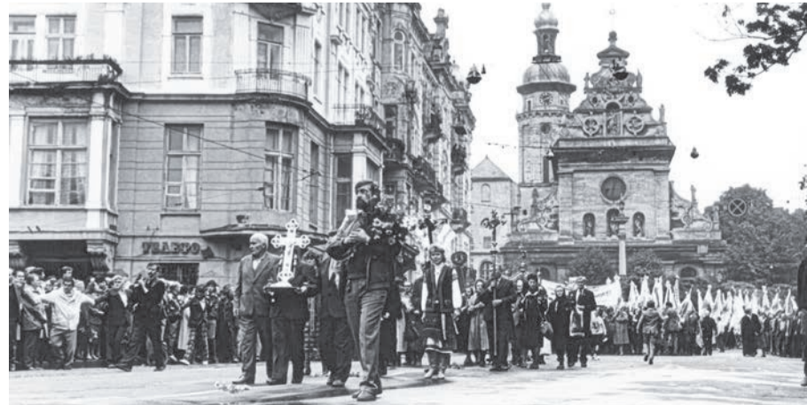
На фото: маніфестація вірних УГКЦ вулицями Львова (17 вересня 1989 р.)