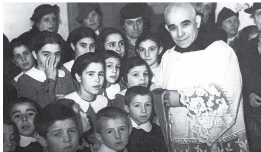
Св. Луїджі Оріоне, засновник Згромадження Оріоністів

Підготували Ростислав КОЦЮБАН, Максим ГОРУНА, «Духовна велич Львова»