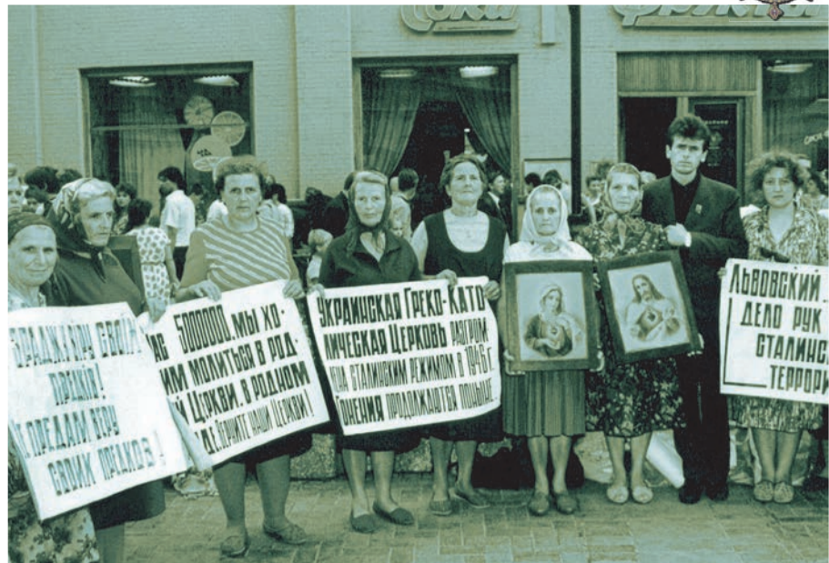
На фото: вірні УГКЦ на Арбаті у Москві вимагають визнання Церкви (1989 р.)

– Миряни в основному оберігали віру. У сім'ях бабусі, дідусі у вірі виховували