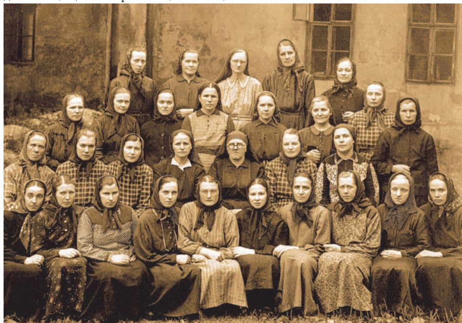
На фото: сестри підпільного монастиря 1953 рік