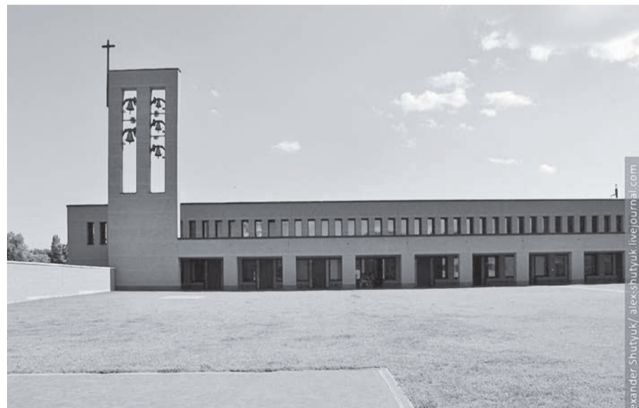
Обитель отців Оріоністів у Львові – монастир Святих апостолів Петра й Андрія