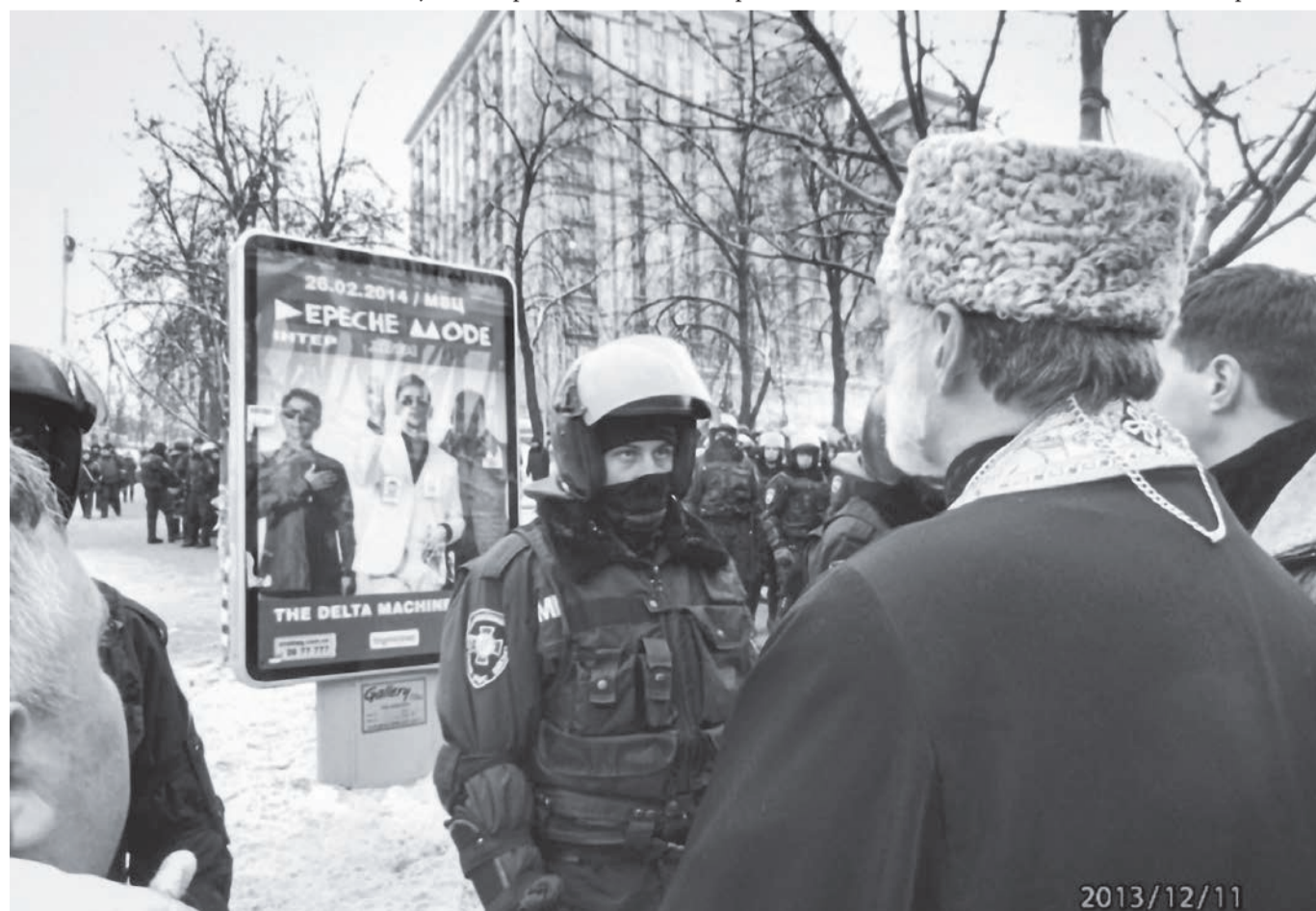
Владика Борис спілкується з правоохоронцем під час Революції Гідності в Києві, 11 грудня 2013

Коли ми є у добрій формі, то можемо приймати рішення. Швидко, більш правильно. Не під впливом комплексів, страхів, упереджень, образ. Треба працювати над своєю внутрішньою цілісністю. Це дає великий спокій. Я думаю, що вся Україна це бачила у Блаженнішому Любомиру Гузарі. Не у фізичній формі була його сила. Блаженніший Любомир промовляв і був лідером моральним, бо в нього всередині був Бог. І він цим променив: своєю людяністю, своїми жартами. Цього люди потребують. Думаю, що наприкінці життя це виявилось хоча б трошки у Стіва Джобса. Бо він мав жаль, як він ставився до людей. До доньки, яку не визнавав довший час. Він фірми із собою не взяв у вічність. Тому одне другого не виключає. Але бажаю всім мати цей досвід – бути з тими людьми, які допомагають тобі бути людиною. Путін має «успіх», але колись він опиниться на смітнику історії, як Брежнев та Черненко.