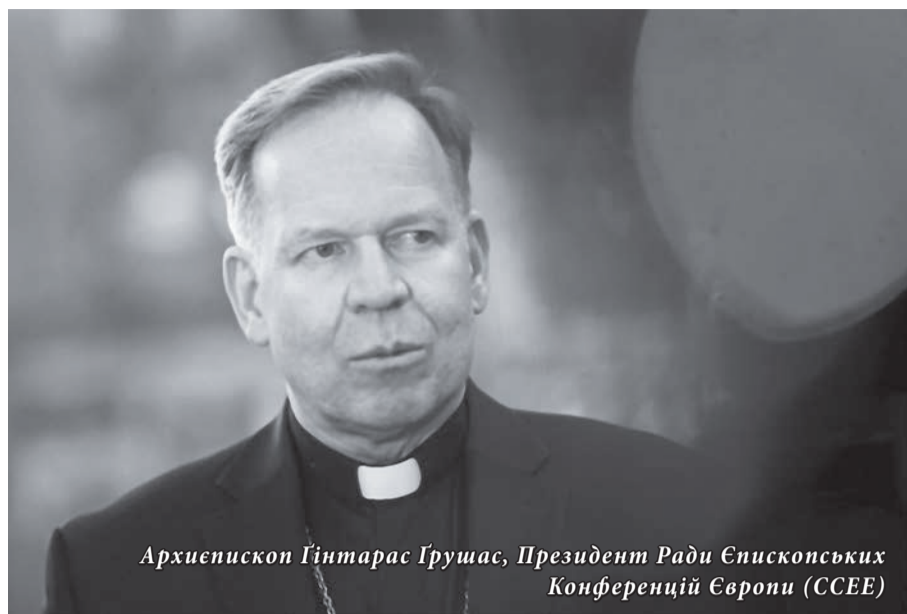
Архієпископ Гінтарас Грушас, Президент Ради Єпископських Конференцій Європи (ССЄЕ)

Рада Єпископських конференцій Європи оприлюднила Звернення на підтримку України «перед загрозою військового вторгнення Росії» та закликала світових лідерів до готовності «захистити міжнародне право, незалежність та територіальний суверенітет кожної держави». У документі, підписаному президентом Ради архієпископом Гінтарасом Грушасом, католицькі єпископи Європи висловлюють слова солідарності з українським народом: «В той час як міжнародна спільнота вбачає у діях російських збройних сил реальну загрозу для миру в усьому світі, у час страху та непевності для майбутнього України, ми єднаємося з нашими братами і сестрами у вірі та з усім українським народом».