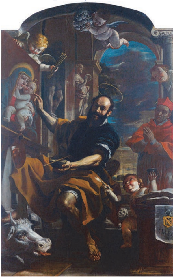
Святий Лука малює Мадонну з Немовлям. (Маттіа Преті (італ. Mattia Preti; 24 лютого 1613, Таверна + 3 січня 1699, Валлетта) — італійський художник.

Твори Луки написані гарною грецькою мовою з великою різноманітністю, елегантністю та проникливістю. Однак висока освіта євангелиста виражена не лише в вишуканій грецькій мові. Автор Євангелія та Діянь взорується на античні літературні зразки, в тому числі історичні. Нагомість ви не побачите у диптиху Луки єврейських слів чи прямих цитат зі Старого Завіту. Адже Лука єдиний з