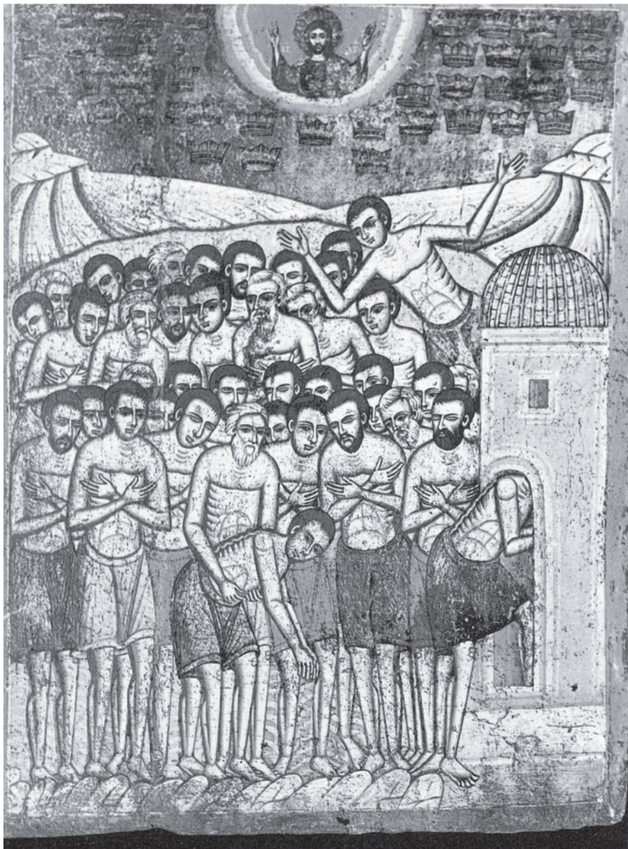
Сорок Севастійських мучеників (ікона XVIII-століття)

– Час війни для кожного українця має бути часом зміни. Коли у мене виникають лихі думки, я повинен пам'ятати, скільки людей віддали за мене своє життя, щоб я став кращим і допоміг змінитися тим, хто є біля мене. Ми будемо мати багато негативних прикладів. Але завжди треба дивитися на найкращих, навіть якщо їх – одиниці.