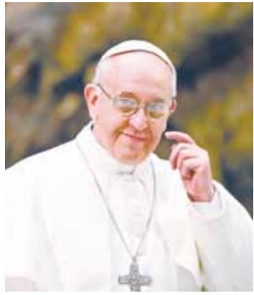
Папа Римський Франциск