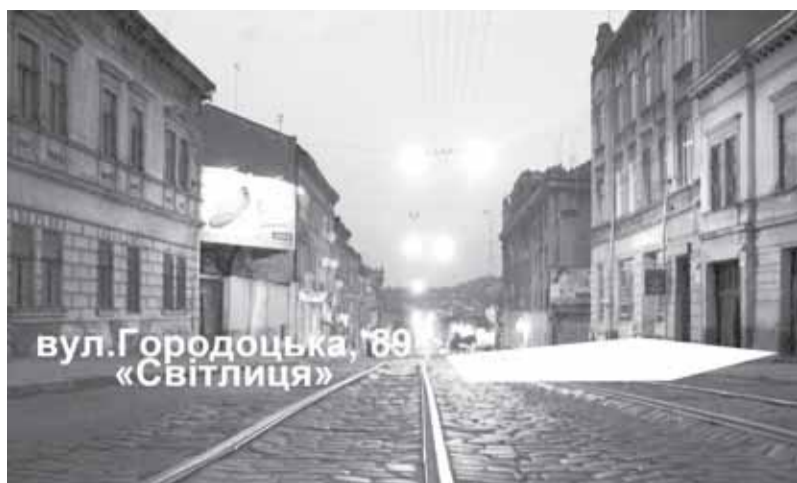
вул. Городоцька, 89 «Світлиця»

Неподалік храму свв. Ольги та Єлизавети, у «Світлиці», що на вул. Городоцькій, 89, відбуваються зустрічі малозабезпечених та безпритульних людей, під час яких потребуючі можуть послухати духовну науку, підкріпитися безкоштовною їжею, а тепер також проконсультуватися з лікарем та отримати медикаменти.