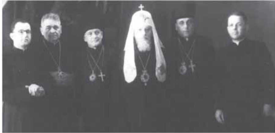
Делегація учасників Львівського псевдособору 1946 року на прийомі в Москві. Зліва направо - свящ. Євген Юрик (згодом митрополит Львівський Микола), керівник т. зв. «Ініціативної групи» протопресвітер д-р Гавриїл Костельник, члени групи єпископ Станіславський і Коломийський Антоній (Пельвецький) Патріарх Московський Алексій I (Симанський), єпископ Дрогобицький і Самбірський Михайл (Мельник), свящ. Іван Лоточинський.

душпастирями! Так було зліквідовано Львівську Богословську Академію – найвищу українську цитадель духовності.