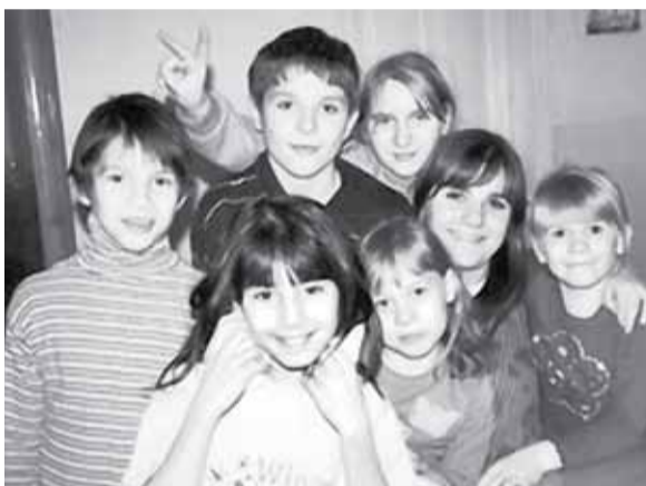
дітей, а як винагороду отримали неймовірну кількість вдячних щирих дитячих посмішок.

Боляче визнавати, що таких дітей навколо нас досить багато, але водночас приємно усвідомлювати, що в наших силах є можливим зробити їхнє життя яскравішим, веселішим, кращим. Як не дивно, ці маленькі люди не так то вже й дуже потребують матеріальних речей, про котрі ми для них постарались. Для них набагато важливішими є проста щира посмішка, душевна розмова, міцні обійми чи тепле слово. Тому ми намагались стати таким необхідним дружнім плечем для обділених