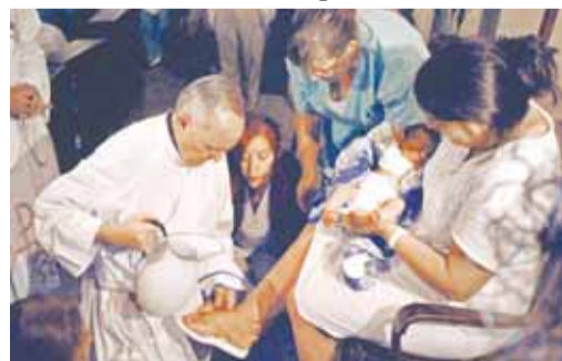
Папа обмиває ноги матерям