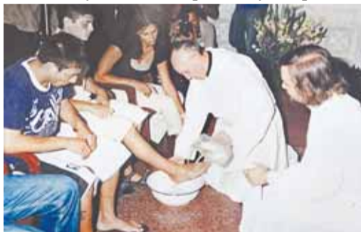
Папа обмиває ноги хворим на СНІД