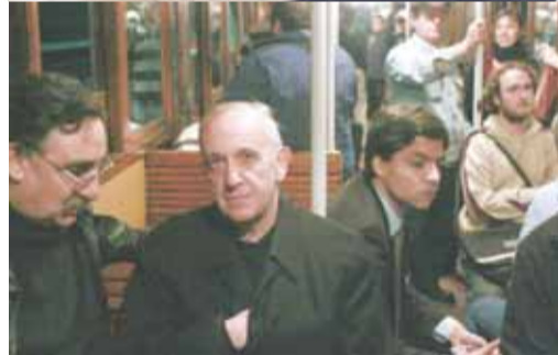
Майбутній Папа Франциск у метро