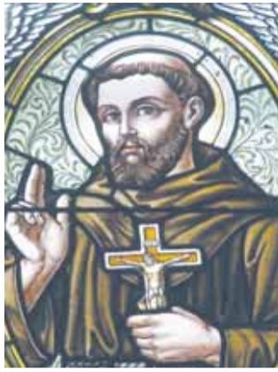
Св. Франциск з Асизи