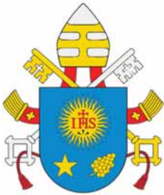
Герб Папи Франциска