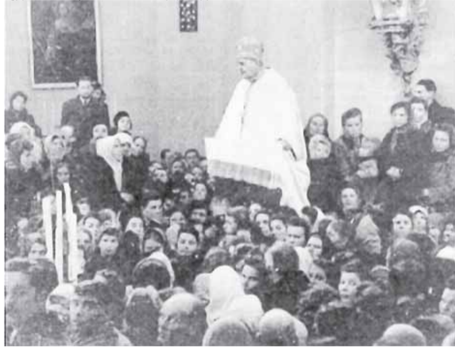
Виступ о. Гавриїла Костельника 8 березня 1946 року під час відкриття Львівського псевдособору.

Євангелист Матей відтворює ті ж слова: «Входьте тісними дверима, бо просторі ті двері й розлога та дорога, що веде на погибель, і багато нею ходять. Але тісні ті двері й вузька та дорога, що веде до життя, і мало таких, що її знаходять» (Мт. 7, 13-14). Тут слова Ісуса передані по-іншому: Він стверджує, що «мало» увійде через тісні двері, а ось на погибель вирушить «багато». Вузькі двері означають дотримання заповідей згідно з відповіддю, яку дав Господь юнакові, коли той запитав, що потрібно, щоб увійти в життя вічне: «Як хочеш увійти в життя, додержуй заповідей» (Мт. 19, 17). А широким шляхом ідуть ті, які чинять відповідно до своїх поганих нахилів і примх.