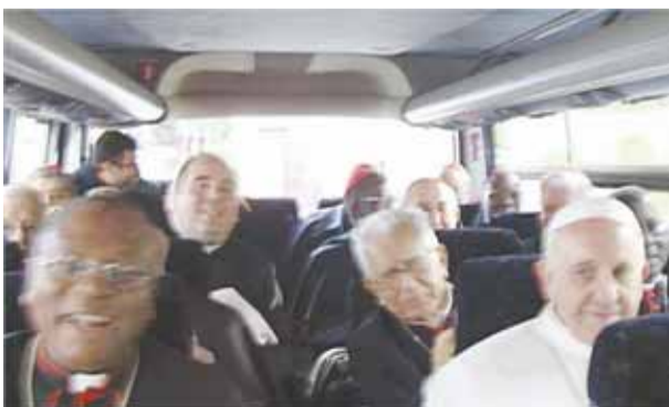
Папа Франциск відмовився від послуг персонального авто і їде разом з кардиналами у салоні мікроавтобуса на другий день після обрання.

Цю молитву Папа Франциск написав, ще будучи Архiepіскопом Буенос-Айреса. Ось п'ять кроків цієї молитви: