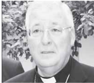
він нарахував 17 законів та указів «проти життя, шлюбу і сім'ї».

За словами єпископа, корінна причина – парадигма, породжена «сексуальною революцією», що має продовження в «антропологічній революції, яка бажає змінити природу людини». В Іспанії