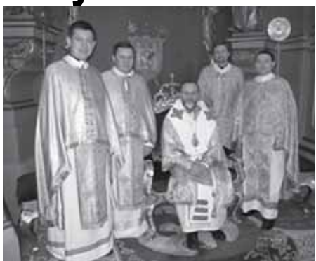
Митрополичого трибуналу сумлінно та бездоганно виконувати свої обов'язки у своєму суддівському служінні.

По завершенні Літургії владика Ігор побажав новопризначеним суддям