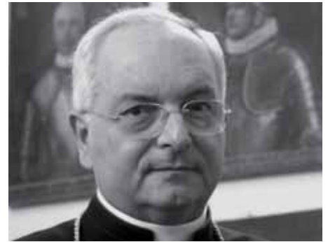
На фото: Кардинал Мауро Пьянццо

У посланні, яким засновується новий фонд, Папа Венедикт XVI нагадав, що «Kirche in Not» надає допомогу нужденним церковним громадам і вірним ось уже впродовж декількох десятирок років. Організацію після Другої світової війни заснував священник Веренфрід ван Страатен з благословення Папи Пія XII. Спочатку її метою було надання допомоги німецьким переселенцям. Тоді ж було висунуто і гасло: через благодійність – до примирення! Нині ця міжнародна організація користується підтримкою 600 000 до-