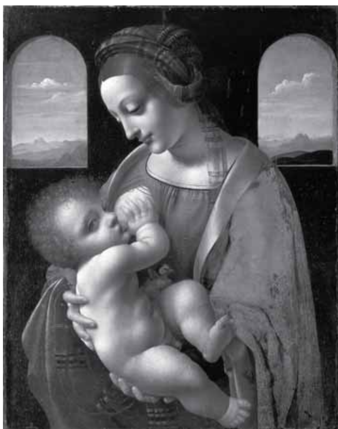
«Мадонна Літта» (1490-1491) — картина італійського художника Леонардо да Вінчі.

Після цього випадку материнство (або, принаймні, материнство з маленькими дітьми) у моїй свідомості почало асоціюватися з чимось соромітним. До того ж, свої груди я на той час навчилася оцінювати з точки зору сексуальної привабливості: