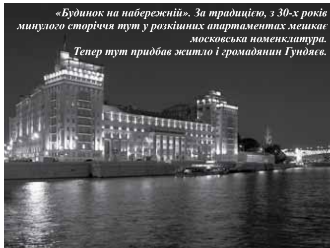
«Будинок на набережній». За традицією, з 30-х років минулого сторіччя тут у розкішних апартаментах мешкає московська номенклатура. Тепер тут придбав житло і громадянин Гундяєв.

Ще один атрибут розкоші, який став предметом широкого обговорення, – годинник «Breguet» вартістю близько 30 тисяч євро, який зазримували на лівій руці патріарха поряд з чернечими чотками українські журналісти. Сталося це наступного дня після того, як Кіріл високопарно віщав у прямому ефірі головних українських телеканалів: «Дуже важливо навчитися християнській аскезі. Аскеза – це здатність регулювати свої потреби. Це перемога людини над похотями, над пристрастями, над інстинктом. І важливо, аби цією якістю володіли і