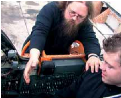
На верхньому фото: Протоієрей РПЦ і професор Московської духовної академії Андрій Курасв пояснює молодому священикові призначення бойового обладнання у кабінеті літака-ракетоносця.

Протоієрей Всеволод Чаплін, який відповідає за зв'язки Церкви і суспільства, вважає, що незабаром у світі розпочнеться «велика війна». Зараз на планеті відбувається безліч конфліктів, які напевно можуть вилитися в серйозне воєнне протистояння. Аби війна не торкнулася території Росії, влада країни повинна «розрулювати» конфлікти на Близькому Сході та в Центральній Азії. Чаплін не сумнівається, що в майбутньому міста будуть знищені – саме до цього прямує людська цивілізація, передає «Интерфакс».