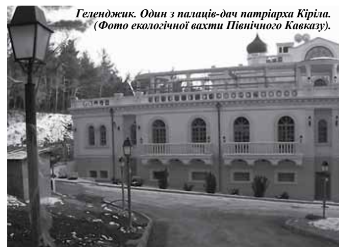
Геленджик. Один з палаців-дач патріарха Кіріла. (Фото екологічної вахти Північного Кавказу).

Окрема і майже невичерпна тема – палаци та резиденції патріарха. Кіріл прагне і в цій справі не відставати від перших осіб держави. Його постійною житловою резиденцією вважався новозбудований