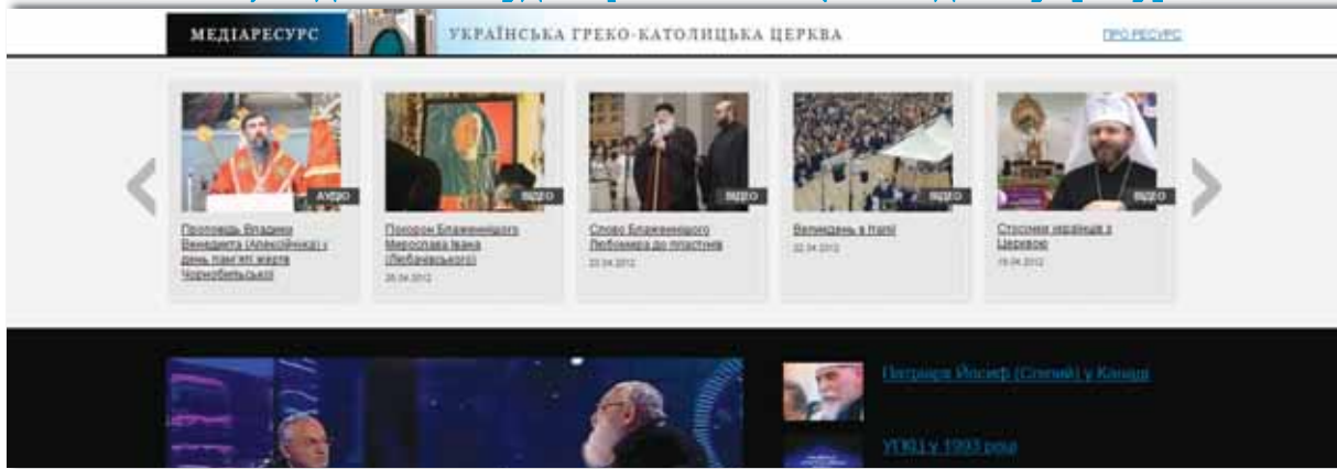
Фото-, відео- та аудіо файли УГКЦ на одному ресурсі

Українська Греко-Католицька Церква в мережі інтернет презентує медіаресурс, який започатковано для того, щоб усі охочі мали можливість в одному місці ознайомлюватися з фото-, відео- та аудіо файлами УГКЦ – ugcc.tv створено та підтримується Департаментом інформації УГКЦ.