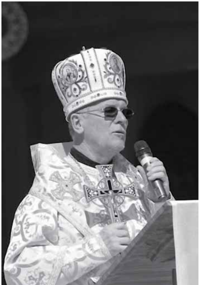
Проповідь Преосвященного Владика Діонісія (Ляховича), ЧСВВ, Апостольського Візитатора під час Свята матері у Римі.

Святкування Дня матері в Італії, яке організує Українська Греко-Католицька Церква для українських матерів-заробітчанок, – найбільший вияв любові та поваги до жінки, яка дала життя, яка несе материнство і яка у пору безпорадності нашої влади взяла на свої плечі забезпечення сім'ї та родини.