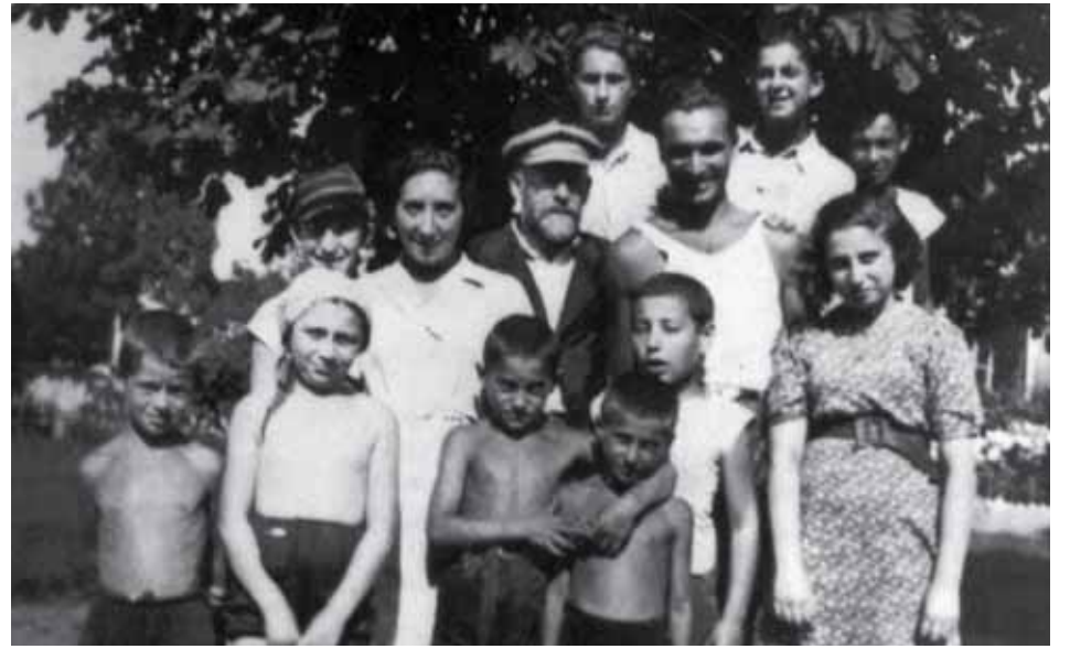
На фото: вчитель і письменник Януш Корчак стоїть у другому ряді справа, третій.

Я знову згадав того Іцика – дитину війни. Іцик був несповна розуму, його привезли невідомо звідкіля в будинок інвалідів. На вид мав років