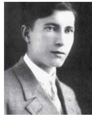
Теодор Ромжа гімназист 1929 рік. (Закінчення, початок у попередніх числах.)

Судоплатов розкриває ще одну маловідому причину такого рішення. Він пише, що Ромжа володів відомостями про ситуацію в керівних колах України, про плановані заходи проти бандерівського руху. Ця інформація до єпископа надходила від черниць, які тісно спілкувалися із жінкою Івана Туряниці – першого секретаря обкому партії та обльвиконкому. «Обидві посади той обіймав одночасно і користувався великою повагою та любов'ю населення, – пише Судоплатов. – На гаслах і транспарантах, розвішаних в Ужгороді до жовтневих свят, було написано: «Хай живе 30-та річниця Жовтневої революції та Іван Іванович Туряниця!» Від Ромжі відомості про ситуацію в українському керівництві потрапляли до Ватикану, а звідти через московську агентуру – до Кремля. Це створювало справжню небезпеку для Хрущова у владних інтригах. Тому постала потреба таємно ліквідувати всю уніатську церковну верхівку в Ужгороді, яка надає усіляке сприяння бандерівцям.