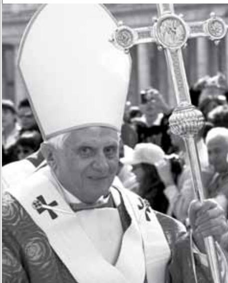
Святіший Отець очолив свято-богослужіння в ватиканській базиліці на свято П'ятидесятниці. «П'ятидесятниця - це свято єдності,

взаєморозуміння і спілкування між людьми» - сказав Бенедкт XVI в проповіді під час Євхаристії. Папа підкреслив, що з розвитком науки і техніки ми намагаємося доминувати над силами природи і звертатися до Бога нам здається непотрібним, оскільки думаємо, що самі зможемо побудувати та здійснити все те, чого хочемо. Папа акцентував увагу також на значенні слів Євангелія свята: «Коли ж прийде Він, Дух Істини, навчить вас всій правді» (Ів 16,13). Понтифік зазначив, що Ісус, кажучи про Святого Духа, пояснює чим є Церква, «що діяти як християни не означає замикатися у своєму «я», але означає прийняти у себе Церкву, чи краще, внутрішньо дозволити, щоб вона нас прийняла. «Коли я говорю, думаю, дію як християнин, не роблю цього замикаючись в сво-