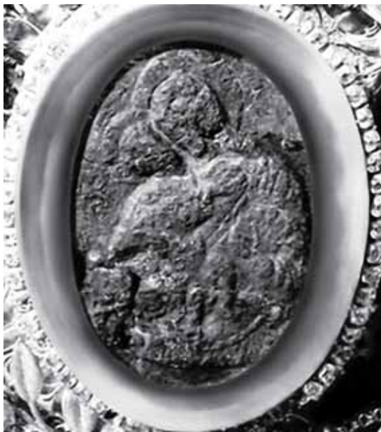
Зараз ікона перебуває в соборі на честь Успіння Пресвятої Богородиці Жировицького монастиря Мінської єпархії і глибоко шанується за її благодатну допомогу.

У 1915 р., зважаючи на воєнний час, ікону у срібному окладі було евакуйовано до Москви й поміщено в со-