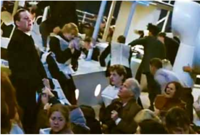
Кадр з кінофільму Джеймса Камерона «Титанік» (США, 1997 р.). Разом з католицьким священником промовляють останню молитву до Господа пасажирів потоплюючого лайнера.

Володар 11-ти «Оскарів» Джеймс Камерон, у своїй знаменитій кінострічці, один із епізодів присвятив священникам. Йдеться про подвиг священників – пасажирів «Титаніка» – 100 років тому, під час найбільшої з морських катастроф. У фатальну ніч з 14 на 15 квітня 1912 року серед пасажирів корабля було троє католицьких священників. Серед них – один греко-католицький. Всі троє відмовилися від місць у рятувальних шлюпках і продовжували служити і надавати допомогу роззубленим і приреченим пасажиром. Цей факт підтвердили люди, яким поталанило врятуватися під час трагедії. Вони засвідчили, що священники продовжували надавати духовну допомогу пасажиром до самого кінця. Їх тіла пішли на дно Північної Атлантики разом з «Титаніком». Один з них був з Литви, другий – з Англії, а третій – з Баварії. (Коментар редакції газети «Мета».)