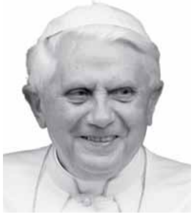
На фото: Венедикт XVI Папа Римський.

Англіканську Церкву називають Церквою, яка з'явилася в Англії після відлучення короля Генріха VIII та його відділення від Риму. Це сталося в 1534 році. По суті, англіканство виникло як «пом'якшена» форма протестантства, що полягала головним чином у запереченні примату (першенства) Римського Папи.