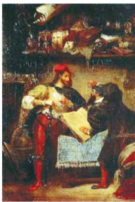
«Мефістофель і Фауст» картина французького художника з доби романтизму Фердинана Віктора Ежєн Делакруа (1798-1863). За сюжетом трагедії Йоганна Гете, доктор Фауст продає свою душу дияволу Мефістофелю. (Mephistophilis, Mephistophilus, Mephistos — з грецьк. одно з імен сатани «той, що ненавидить світло»).

Зробивши ці уточнення, додамо, що йдеться не про якісь теоретичні міркування. Ми звертаємо на це увагу тому,