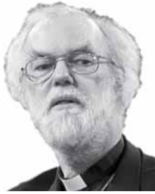
На фото: Архиєпископ Кенан Гібемескел Ровуен Вільямс.

Католицька Церква не визнає висвячування англіканців. Англіканські священники і єпископи не можуть здійснювати дійсне Таїнство Євхаристії, а також відпускати гріхи. Оскільки англіканство є протестантизмом (хоча й у поміркованому вигляді), в ньому діє принцип «Sola Scriptura», а Святе Письмо інтерпретується вільно й індивідуально. І саме