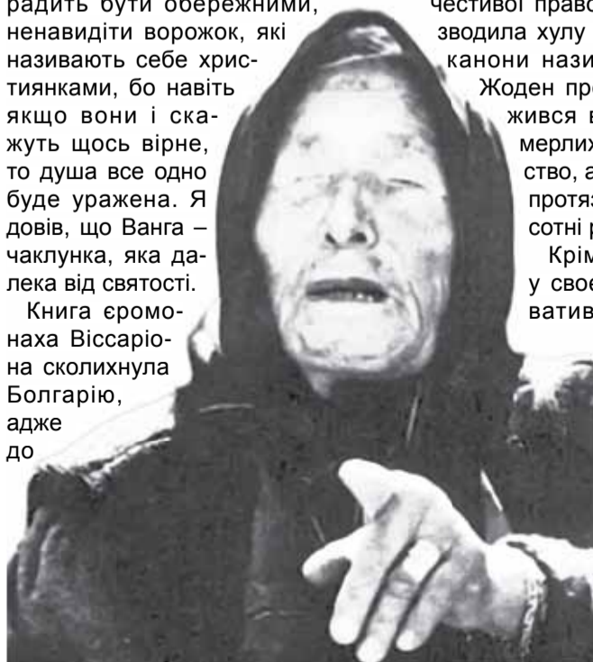
На фото: Слепа болгарська провидиця Вангелія Гуштерова.

Книга єромонаха Віссаріона сколихнула Болгарію, адже до