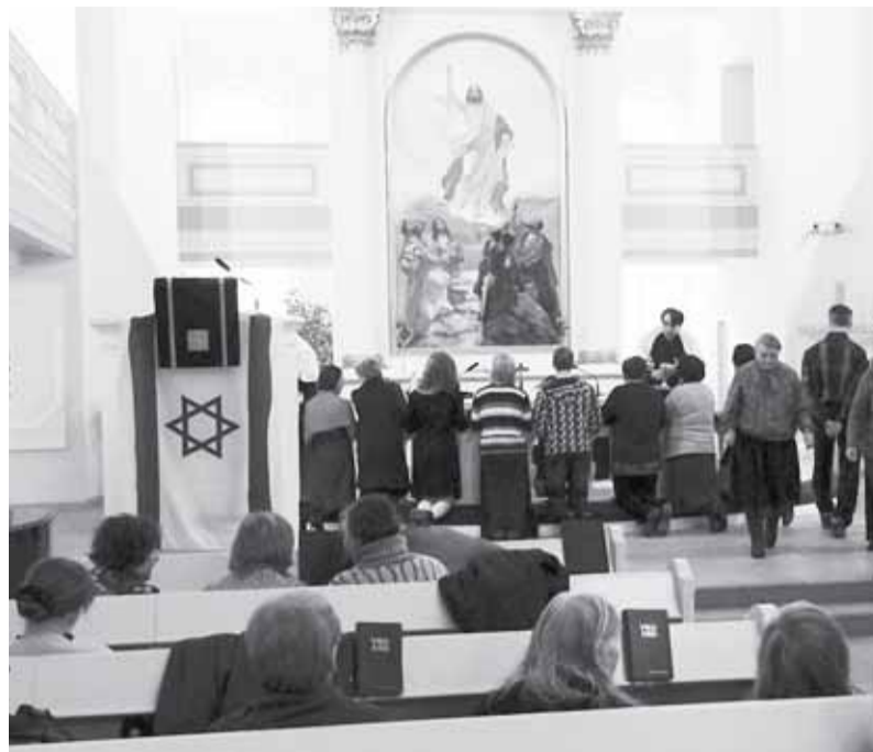
Святкування Пуріму громадою месіянських юдеїв у лютеранському соборі св. Марії (Санкт-Петербург, Росія)

Як і всі протестанти, машахіми приймають основні догмати неподіленої Церкви (про троєч-