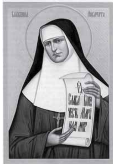
Преподобна Йосафата Гордашевська

У свою чергу, Генеральна настоятелька Згромадження закликала сестер часто роздумувати над життям Преподобної Йосафати, запитуючи себе, чи живемо сьогодні посвятою та вірністю у малих речах, чи на-