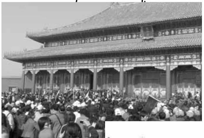
Китаянка Чай Лін – один з лідерів студентської маніфестації на пекинській площі Тяньаньмень – охристілася.

За словами Чай Лін, до нової віри її привело почуття нездатності щось змінити в своїй країні, де зневажаються права людини і принципи демократії. Найстрашнішим і антигуманним, на думку опозиціонерки, є закон, що забороняє сім'ям мати більше ніж одну дитину і змушує китайку робити аборти. «Це – та сама щоденна бійня на площі Тяньаньмень, навіть у сто разів страшніша. І відбу-