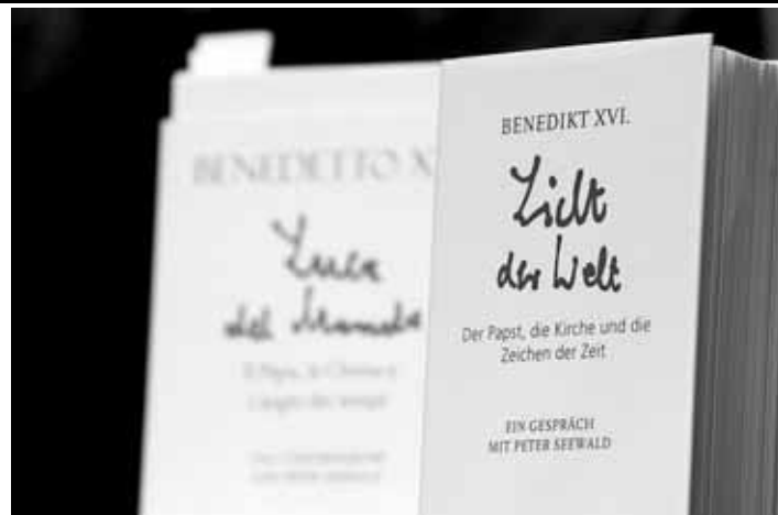
За матеріалами wiara.pl

«Успіх у книгарнях – це цікава подія не лише з точки зору маркетингу. Він також вказує на існування в нашій дні пошуку остаточних відповідей і потреби солідної точки опори», – твердить ватиканська газета.