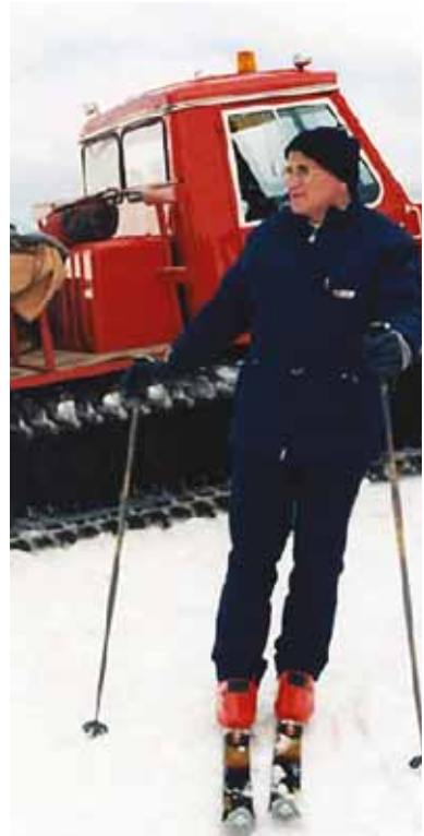
Папа Іван Павло II на протязі життя чернав енергію і сили від постійних занять спортом.

найвідоміших із них належать: «Redemptor hominis» (1979), «Dives in misericordia» (1980), «Laborem exercens» (1981), «Slavorum apostoli» (1985), «Dominum et vivificantem» (1986), «Sollicitudo rei socialis» (1987).