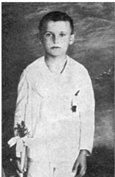
Кароль Войтила під час Великих Свят.

ше любив футбол, лежечарство (лижі), місцеві кремові тістечка (поль. krémówki ) та театр. Мріючи стати професійним актором, у 14 літ Кароль спробував себе у шкільному драматичному гуртку, а також іще в юності написав п'єсу «Король-Дух». Він очолював шкільне Марійське товариство, а в 14-річному віці здійснив свою першу прощу до головної святині Польщі у місті Ченстохова. У 1938 році Кароль Войтила прийняв св. Тайну Миропомазання і здобув свою середню освіту.