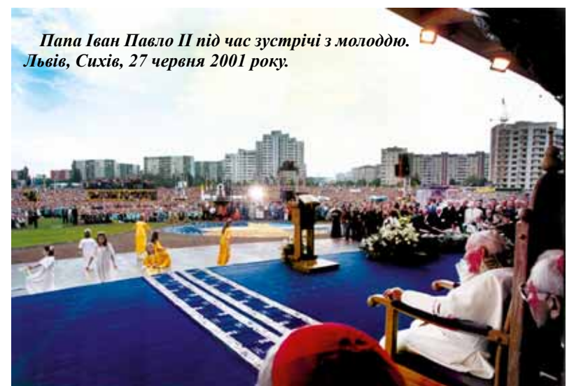
Папа Іван Павло II під час зустрічі з молоддю. Львів, Сихів, 27 червня 2001 року.

Уже після трьох місяців обрання Іван Павло II приймав