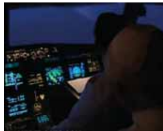
Папа Іван Павло II спостерігає за роботою екіпажу у кабіні.

У книзі також розглядається взаєморозуміння між Папою і журналістами. Один з найпам'ятніших моментів з цих прес-конференцій – коли Іван Павло II говорив про