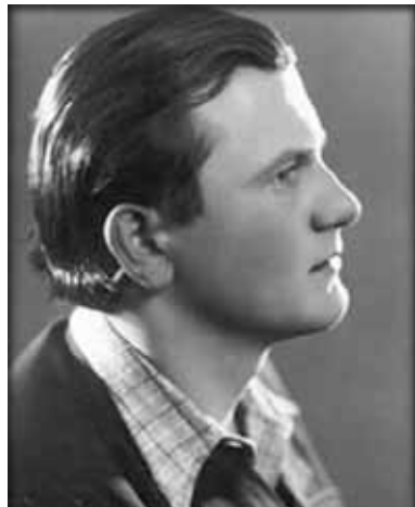
Кароль Войтила актор театру і поет.

ш за все любив футбол, лежечарство (лижі), місцеві кремові тістечка (поль. krémówki ) та театр. Мріючи стати професійним актором, у 14 літ Кароль спробував себе у шкільному драматичному гуртку, а також іще в юності написав п'єсу «Король-Дух». Він очолював шкільне Марійське товариство, а в 14-річному віці здійснив свою першу прощу до головної святині Польщі у місті Ченстохова. У 1938 році Кароль Войтила прийняв св. Тайну Миропомазання і здобув свою середню освіту.