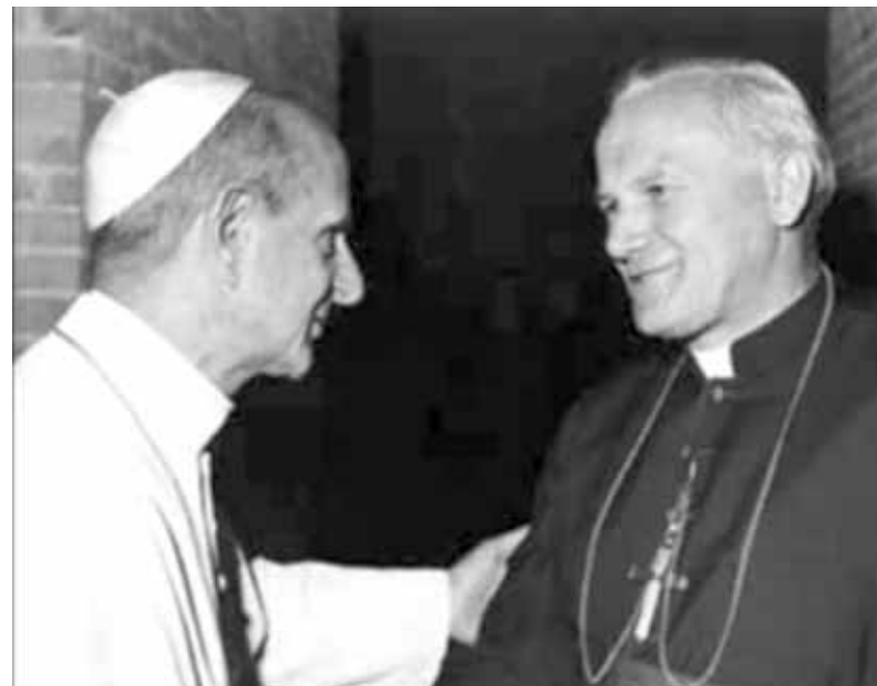
Папа Павло VI і кардинал Кароль Войтила

Коли Кароля Войтила обрали Папою, Церква перебувала у дуже важкому стані. У ХХ столітті відбулися величезні зміни на суспільному, політичному,