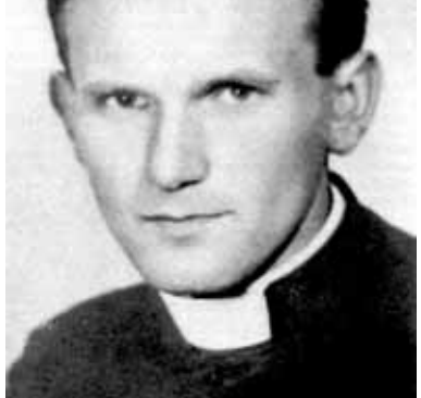
Молодий священник Кароль Войтила

У 1949 році Кароль Войтила починає працювати з університетською молоддю та медиками у парохії святого Флоріана у Кракові, а у 1950-му готує свої перші публікації. 1951 року він бере дворічну відпустку, аби підготуватися до університетських викладів.