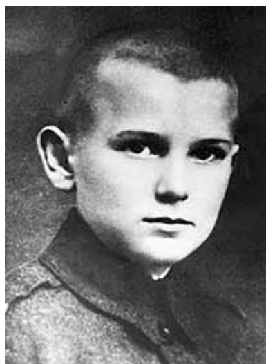
Кароль Войтила у шкільному віці.

ше любив футбол, лежечарство (лижі), місцеві кремові тістечка (поль. krémówki ) та театр. Мріючи стати професійним актором, у 14 літ Кароль спробував себе у шкільному драматичному гуртку, а також іще в юності написав п'єсу «Король-Дух». Він очолював шкільне Марійське товариство, а в 14-річному віці здійснив свою першу прощу до головної святині Польщі у місті Ченстохова. У 1938 році Кароль Войтила прийняв св. Тайну Миропомазання і здобув свою середню освіту.