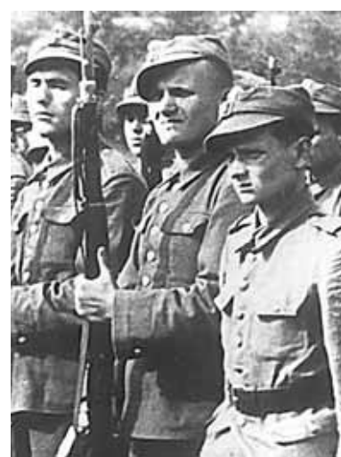
Під час військових зборів напередодні II Світової війни.

У тому ж 1938 році Кароль вступає на філософський факультет Ягеллонського університету і разом з батьком переїжджає до Кракова. Водно-