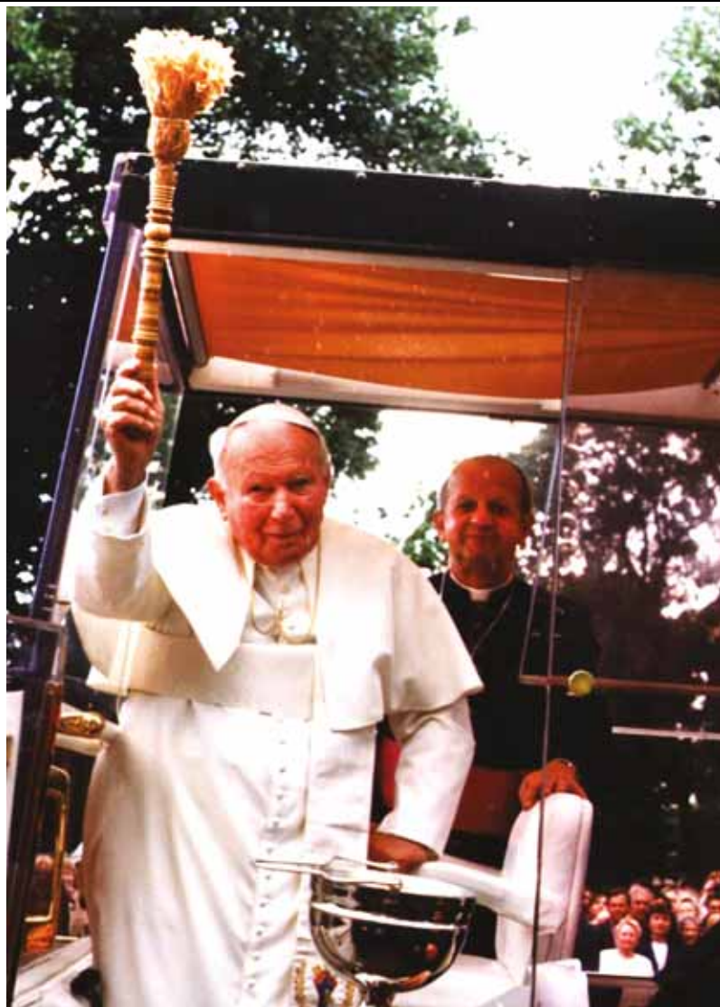
Папа Іван Павло II під час апостольської подорожі в Україну. Львів, червень 2001 року.

Іван Павло II та його курія написали стільки праць, які за кількістю та якістю дорівнюють працям таких великих богословів, як св. Тома Аквінський. Самих лише енциклік Іван Павло II видав 14. До