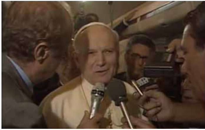
Папа Іван Павло II дає своє перше інтерв'ю на борті літака.

Прес-конференція в небі на висоті майже 2000 м. Це була практика, яка розпочалася з питання американського журналіста до Івана Павла II під час його першої подорожі в якості Папи Римського. Репортер хотів знати, чи відвідає він Сполучені Штати. Іван Павло II заявив, що він обов'язково відвідає країну, але повинен буде визначити коли. Це запитання поклато початок звичаю, який тепер здається нормальним під час папської подорожі, але до того часу було нечуванним і немислимим.