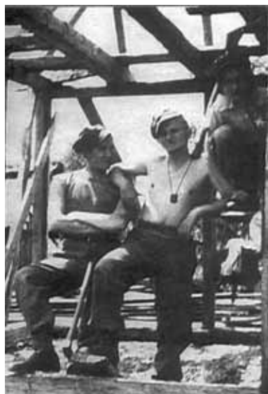
Каменоломня. Кароль з приятелями.

Юнак регулярно відвідував ігри футбольного клубу «Кра-