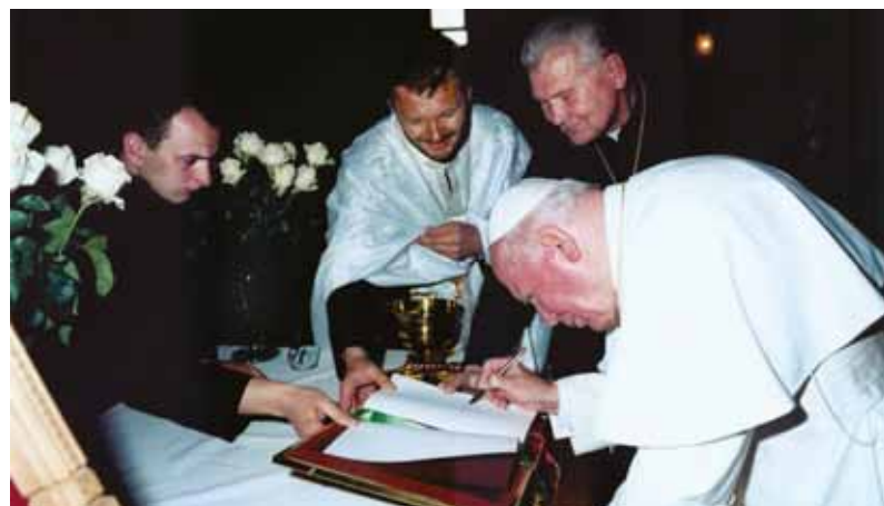
Львів, Сихів, церква Різдва Пресвятої Богородиці. Папа Іван Павло II залишає свій автограф у пам'ятній книзі парафії.

26-річний понтифікат Івана Павла II став третім за тривалістю в історії Католицької Церкви після правління св.