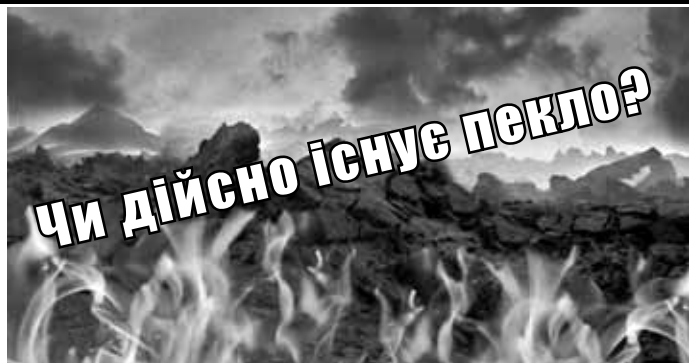
ПЕКЛО ІСНУЄ. ПРО ЦЕ СВДІЧИТЬ ВІРА ВСІХ НАРОДІВ ТА УСІХ ЧАСІВ

Те, в що завжди й в усі часи вірили народи, становить так звані правди здорового глузду або загальноновизнані правди. Про того, хто опирається прийняти будь-яку з тих великих, загальноновизнаних правд, можна сказати, що йому бракує здорового глузду. Воістину, треба бути безумним, аби вважати себе мудрішим за цілий світ.