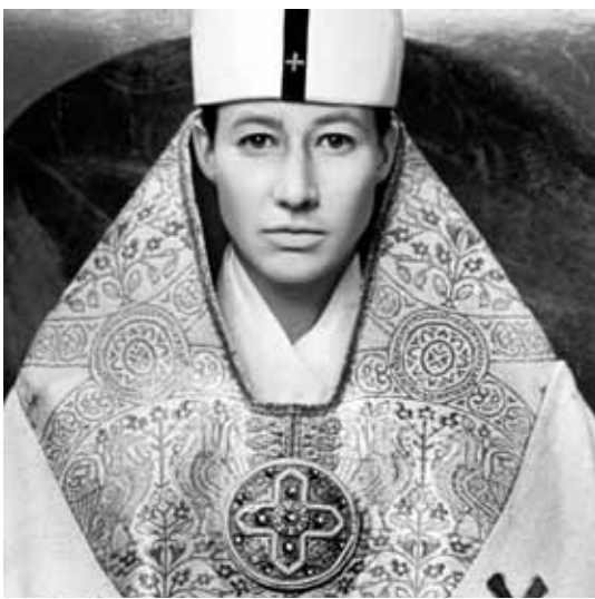
Кадр з кінофільму режисера Зенке Вортмана «Папеса Йоанна».

Друга версія – це розповідь Мартіна Полонія (або Поляка), також домініканця. Він пише, що після смерті Папи Лева IV в 855 році протягом трохі більше двох років папський престол займав англієць Йоан із Майнца. Автор повідомляє, що це була жінка, яка прославилася своєю вченістю. У Римі її таланти оцінили так високо, що вона була вибрана Папою. Під час понтифікату вона завагітніла і померла в пологах по дорозі від собору св. Петра до Латеранської базиліки. Мартін стверджує, що її ім'я згодом приховувалося через те, що вона була жінкою і повелася негідно. Проте, згідно з іншим рукописом, Йоанна вижила і провела решту своїх днів в покаятні.