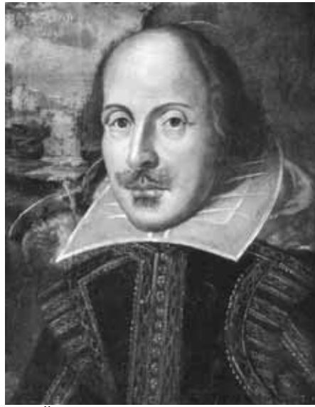
да у Йоркширі – колиски католицького неоконформізму. Документи 1592 року також засвідчують, що батько Вільяма Джон відмовлявся брати участь в англійканських богослужіннях.

Професор університету «Аве Марія», що у штаті Флорида, Джон Пірс у своїй праці «Боротьба за Шекспіра» нагадує, що поет походить зі Стратфор-