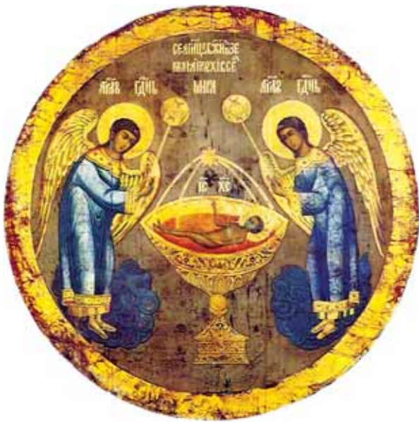
Христос встановлює Тайнство Пресв. Євхаристії. (Старовинна ікона невідомого художника).

«Євхаристійний піст» пов'язаний з відсутністю апетиту, небажанням або й відразою до їжі. В дуже тяжкій формі його переживала св. Катерина Сієнська. З розповідей її сповідника відомо, що, попри старання нормально їсти, свята ніяк не могла себе до цього примусити. Шлунок нічого не перетравлював, і все прийняте всередину поверталось назад, на-