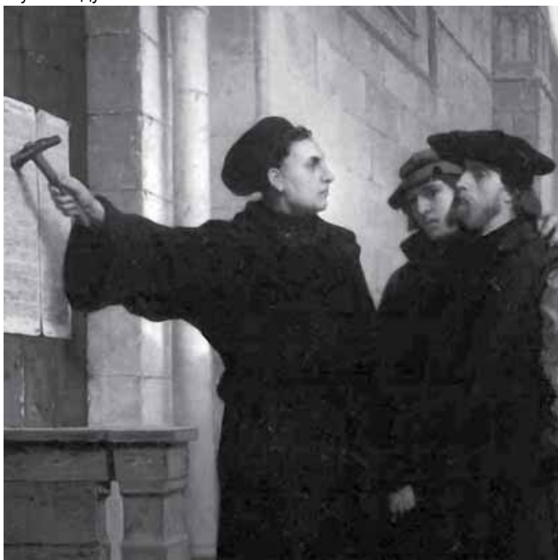
На картині: Лютер прибуває свої 95 тез на воротах церкви у 1517 р.

у м. Віттенберг, звинувачуючи католицьку церкву в корупції і ересі.