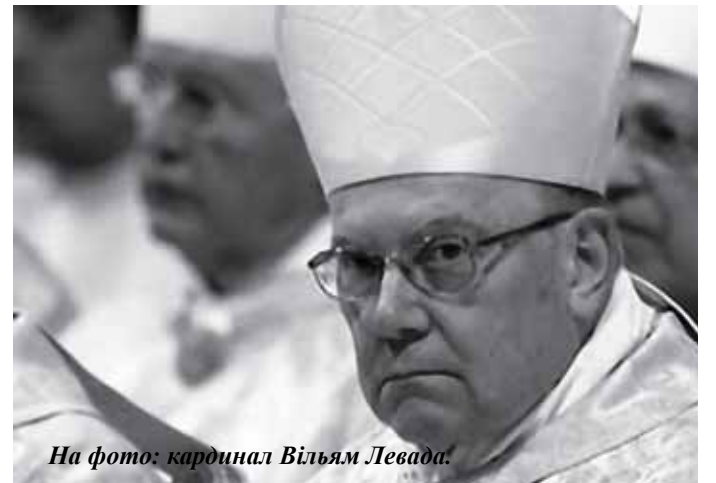
На фото: кардинал Вільям Левада.

За словами кардинала, очікується, що вже на самому початку до ординаріату вступить близько двох тисяч осіб. Окрім того, до Конгрегації доктрини віри вже відіслано 67 анкет від англіканського духовенства, які бажали би прийняти священня в Католицькій Церкві. 35 із них вже отримали попереднє схвалення і тепер перейшли в наступну стадію – перевірка їх стосовно кримінального минулого, психологічне оцінювання, рекомендація від місцевого католицького єпископа та місцевого англіканського провідника (якщо можливо).