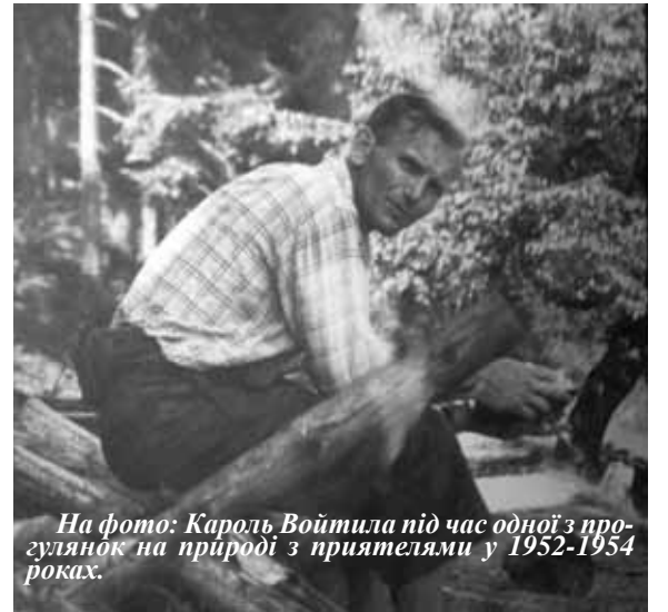
На фото: Кароль Войтила під час однієї з прогулянок на природі з приятелями у 1952-1954 роках.

687-сторінкова книга «До правди і свободи: комуністична таємна поліція і Кароль Войтила» відкривається поліційним документом, датованим травнем 1946 року. Тоді майбутній Папа Римський був ще семінаристом, і вже тоді його зв'язки з патріотичною студентською групою в Кракові викликали увагу спецслужб.