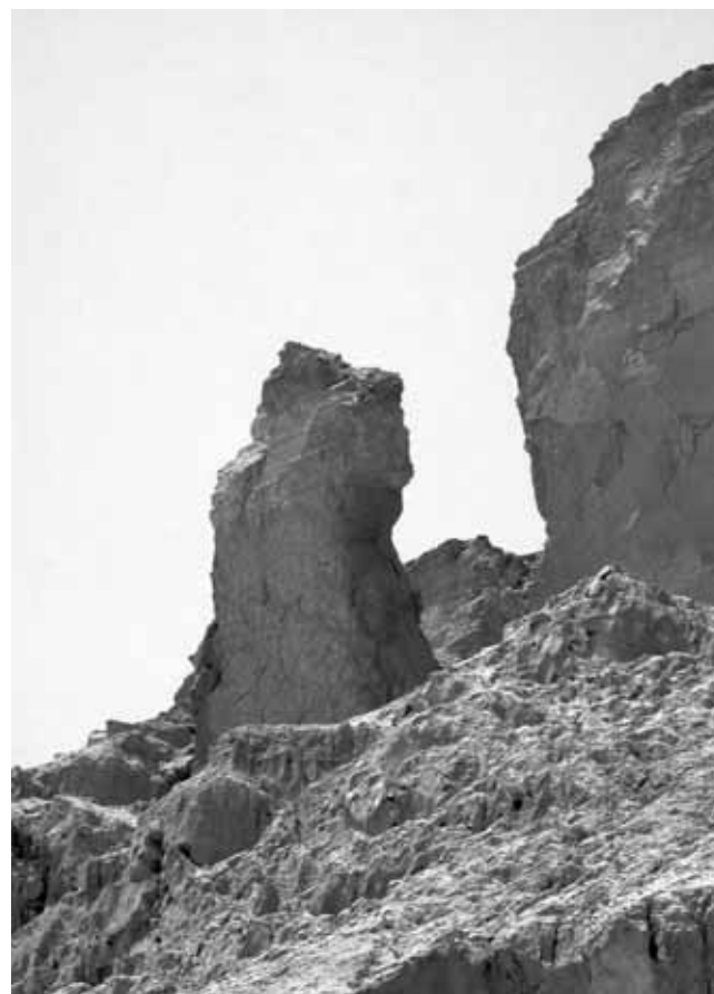
Скеля Содомського хребта (Ізраїль), яку туристам демонструють, як дружину праведного Лота, що за Біблійним переданням перетворилася на соляний стовп.

первородний, що його страшні наслідки вже довгі тисячі літ несе на собі ціле людство і буде нести їх до кінця світу.