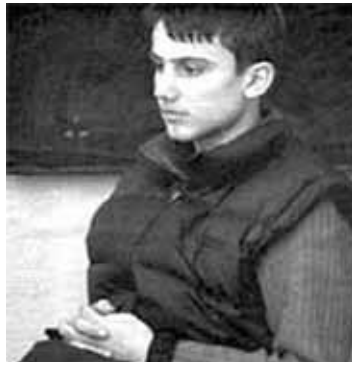
каатоликів, а тому газета «Алія» стверджує, що Дж'гереная є єдиним православним стигматиком.

Вважається, що стигматизм поширений в основному серед