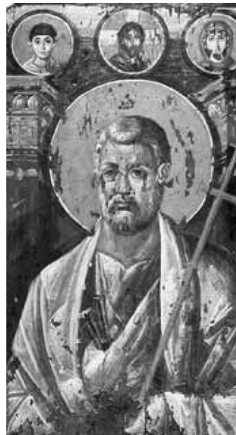
Апостол Петро. Ікона виконана технікою енкаустики. VI століття. Монастир святої Катерини. Синай.

Сама Мамертинська темниця була споруджена в VII столітті до нашої ери і призначалась для тимчасового утримання підслідних та підсудних (римське право не передбачало покарання у вигляді тюремного ув'язнення). Темниця з'єднувалась підземним каналом з Великою клоакою – римською каналі-