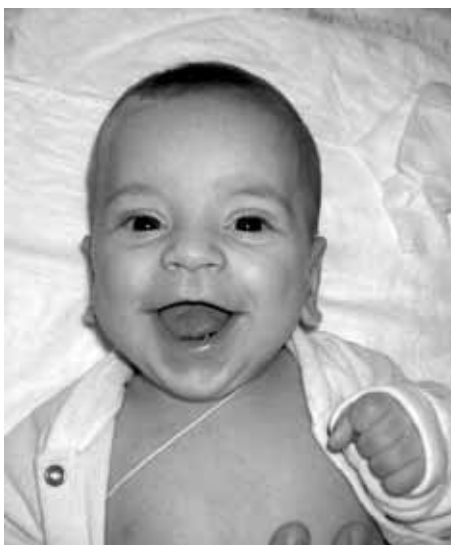
Американські учені встановили, що вже у віці від 6 місяців діти здатні розрізнити добро і зло, пише «The

Telegraph». До такого висновку дійшли дослідники з «Infant Cognition Centre» при Єльському університеті, які попросили дітей різного віку вибрати персонажі, які поведилися добре або погано. Як наслідок – у більшості своїй діти вибирали «добрих» персонажів.