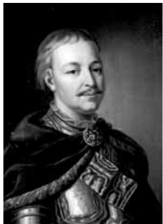
Гетьман Іван Мазепа

Ідеться не про те, хто для мене особисто Мазепа... Найпростіше я б міг сказати, що він є національний герой, авторитет. Безсумнівно, він – один із найбільших українських гетьманів, видатна постать в українській історії, чи не найбільш відома у світі. І цього було б досить. Але сьогодні варто говорити не про це, а про нахабство людини з чужої країни, яка пропонує нам змінювати назви вулиць.