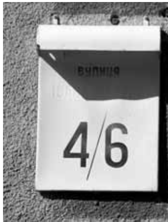
До приїзду московського Патріарха Кирила на будинках вулиці Івана Мазепа, що у Києві з'явилися таблички з написом «вулиця Лаврська». Київрада, яка 3 роки тому сама дала вулиці ім'я українського гетьмана, тепер проголосувала за її перейменування.

Колись, у давні темні роки, у Церкві були прийняті анафема на людей, котрі виступали проти християнської віри, руйнували основи Церкви. У цьому розумінні до Мазепа не могло бути жодних питань... Навпаки, питання були до Петра I, який влаштовував свого роду сатанинську евхаристію в середовищі своїх наблизених. Висміював православне духовенство, організував всешутейші собори, коли під час п'яних оргій надягали церковні ризи й пили з церковних чаш. Це справді був