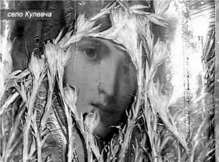
Напередодні святкування Трійці у церкві села Кулевча Одеської області за склом ікони Пресвятої Богородиці на засохлих стеблах з'явилися молоді цибулини. Наступного дня розпустилася перша лілія, а на третій день – розцвіли інші рослини.

ривати» від руки палець, а потім приліплювати його назад. Був час, коли я майже щодня просив його: «Дідусю, покажи, як ти палець відриваєш!» Незабаром я дізнався, що нічого дивного він не творив, а просто вправно ховав палець від мого погляду, вводячи мене в оману і тим приносячи чималу радість. Моя дитяча наївність і недосвідченість дозволяли йому робити це без особливих зусиль.