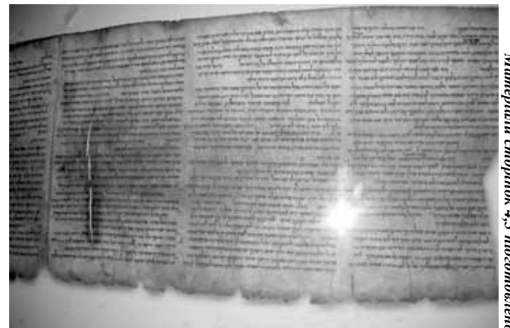
Матеріали сторінок 4-5 підготовлено за публікаціями сайту: http://www.christiansprerel.org/

Учені вивчили сім невеликих фрагментів сувою Храмового. Шматочки пергаменту досліджували за допомогою рентгенівського випромінювання, а потім бомбардували пучками протонів за допомогою прискорювача елементарних часток. В результаті з'ясувалося, що хімічний склад води, яку використовував виробник пергаменту сувою Храмового, харак-