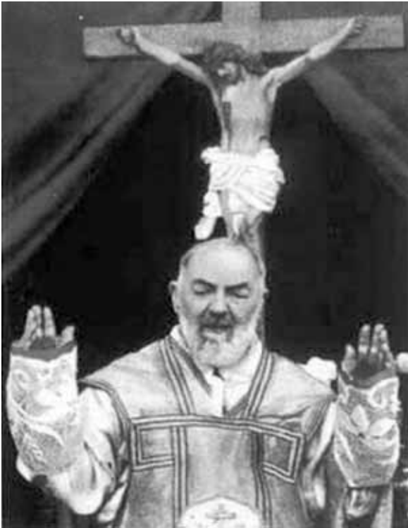
Святий Піо з П'єстрельчіни (світське ім'я: Франческо Форджоне 25 травня 1887, П'єстрельчіна, Італія — † 23 вересня 1968) — італійський святий 20-го століття, відомий стигматик, благодійний діяч та чернець ордену капуцинів.

Можливо, «ангельське пір'я» – і справжнє чудо. Але, погодьтеся, що твердження про його небесну природу набуло б зовсім іншого забарвлення, якби з'ясувалося, що досліджувана пір'їна просто була видерта, опісля оброблена хімічним розчином і, до того ж, належить чубатій лісовій куріпці або рожевому какаду.