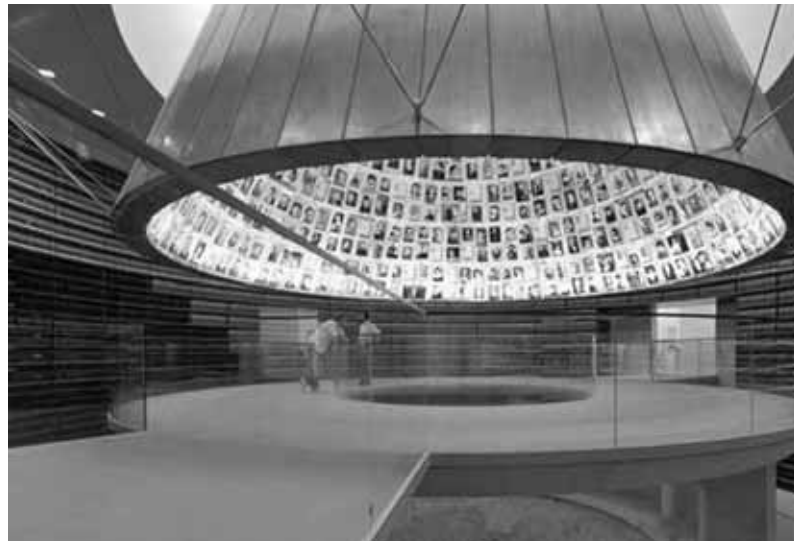
На фото: Меморіальний комплекс Голокосту «Яд Вашем» в Ізраїлі. Можливо стараннями пана Курта Левіна тут буде висаджене дерево, присвячене праведникові світу митрополиту Андрею Шептицькому.

Заходи у м. Владімірі проходили за участі керівництва обласної адміністрації, представників посольств Естонії, Литви, Польщі та України в Російській Федерації, громадських та релігійних організацій Росії, України та інших держав.