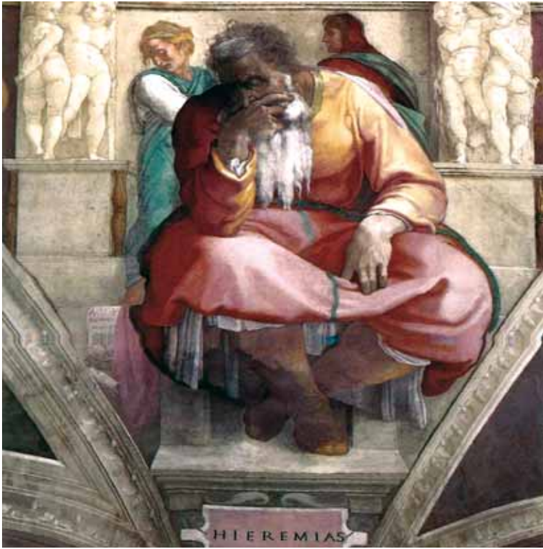
Фреска «Єремія» Мікеланджело Буонарроті, (ім. Michelangelo Buonarroti) - (1475–1564), італійський скульптор, художник, архітектор, поет та інженер. Ще за життя Мікеланджело його твори вважалися найвищими досягненнями мистецтва епохи Відродження.

В Біблії багато говориться про пророків і пророкування. У наш час теж популярні різного роду провісники майбутнього – від ворожок до футурологів. Чи були біблейські пророки кимось на зразок їх? Чи, може, вони передавали людям те, що відкривав їм Бог? І як вони взагалі ставали пророками – цьому десь навчали, як ремеслу, чи кожному Господь вказував особливу дорогу?