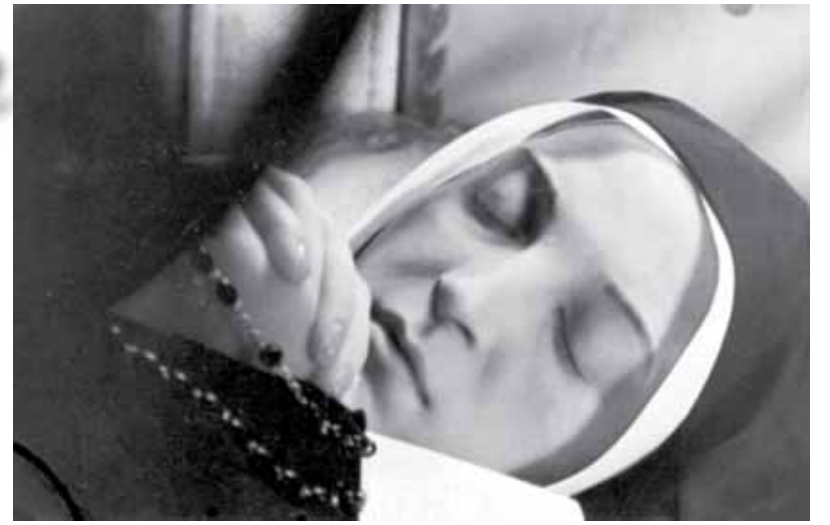
На верхньому фото: так виглядає сьогодні тіло блаженної Бернадети Субіру.

року. 18 липня того ж року його було поміщено в прозорий саркофаг, який встановили в монастирській каплиці, праворуч від головного вівтаря. Канонізація