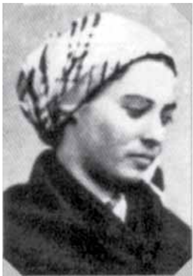
На фото: сестра Бернадета у земному житті

Прочани, які відвідують каплицю монастиря Сен-Жільдар у Невірі, бачать неторкнуте тлінням тіло св. Бернадети, одягнене в чернече обличчя. Бернадета виглядає так, немов спить. Багато хто запитує: «Це й справді вона? Невже її тіло насправді не піддалося тлінню?» Спробуємо відповісти на ці запитання.