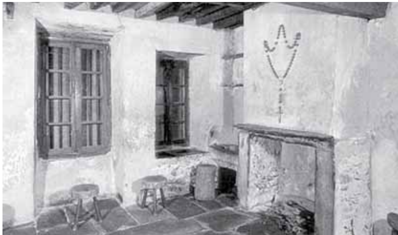
Оселя, де мешкала родина сестри Бернадети

Тіло Бернадети залишалося в каплиці св. Олени до моменту беатифікації, проголошеної Папою Пієм XI 14 червня 1925