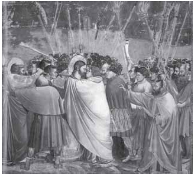
«Поцілунок Юди». Джозетто ді Бондоне (1267-1337), відомий італійський живописець.

Кульмінацію злочинності нащадки Юди проявили у стосунку до Месії-Христа і накликали цим на себе у Господа Бога страхітливе спустошення. Сам Христос-Бог висловив юдеям