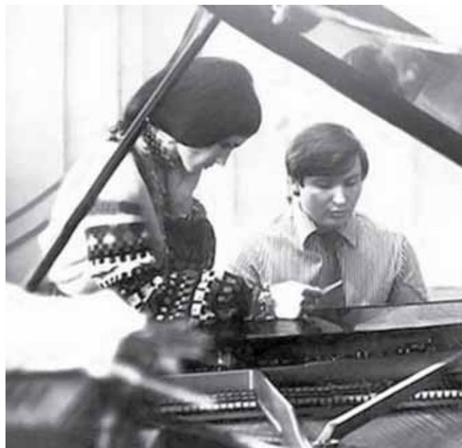
Володимир Івасюк і Софія Ротару працюють над новою пісню.

По закінченні молоді люди прийшли і на могилу Ігоря Білозіра, аби молитовно вшанувати пам'ять і цього відомого українського композитора. На завершення учасники моління побували біля гробниці крилошан Львівської Архидієцезії.