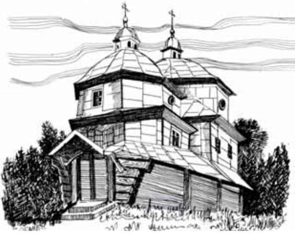
На рис.: церква св. Димитрія, 1878 р. Рис. автора.

Життя місцевої греко-католицької громади, – а на той час це означало української, – починаючи з XIV століття, можна назвати радше не життям, а виживанням. Найперше, воно постійно відчувало спротив польських колоністів, а, по-друге, влада все робила для того, щоб поляки з корінної Польщі почували тут себе краще, ніж на історичній батьківщині. Повінь полонізації в пидльвівських селах, до яких належав і Давидів, була особливо потужною. В цій стихії виживали лише громади, сильні духовно, для яких святою була історична пам'ять, джерела якої постійно намагалися очищати від намулу. І першими, хто дбав тут про духовність селян, були священники. Душпастир на селі в ті часи – це не тільки духовна особа: він виконував роль і вчителя, і адвоката, і судді, і лікаря. Тож саме своїм духовним наставникам і зобов'язані українські давидівці за те, що не щезли в асиміляційній безодні полонізації.