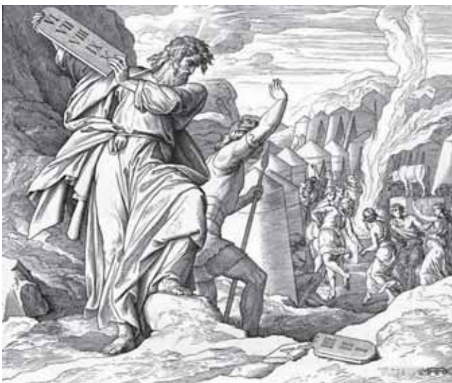
Гравюра. Юліус Шнорр фон Карольсфельд (1794—1872)

Святкування неділі – це найстарша і дуже священна християнська традиція, бо походить від самих Апостолів. Тому для всіх нас участь у недільній св. Літургії та недільний спокій повинні бути чимсь природним, очевидним, просто потребою нашої душі і тіла. Ми не сміємо забувати, що недільний обов'язок є не тільки церковним, але й Божим законом, а Божий закон не знає ані винятку, ані звільнення. Отже, хоч би ми з важливої причини не могли виконати свого недільного обов'язку, то все-таки ми й тоді обов'язані на свій спосіб святкувати неділю, напр., через часту пам'ять на Бога, довшу молитву, побожне читання, пам'ять на вічні правди, обережність у розмові і цілій поведінці.