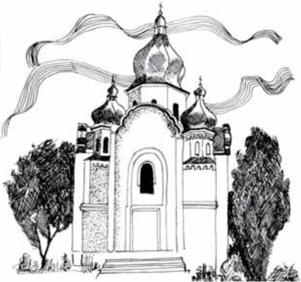
Колишній костел св. Станіслава, а зараз – церква Різдва Пресвятої Богородиці.