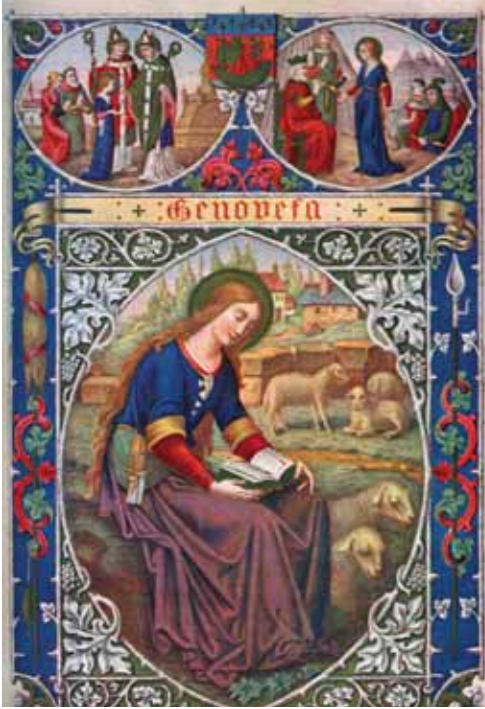
Св. Геновефа берегиня Парижу.

— О, благословенний духу моєї улюбленої жони! Приходь, певно, щоб мене оскаржити за невинно пролиту кров. Чи це страшне вбивство сталося тут? Чи, може, в тій печері лежать тлінні останки твого тіла? Так, напевно, і є, а цей дух показується мені тому, що я