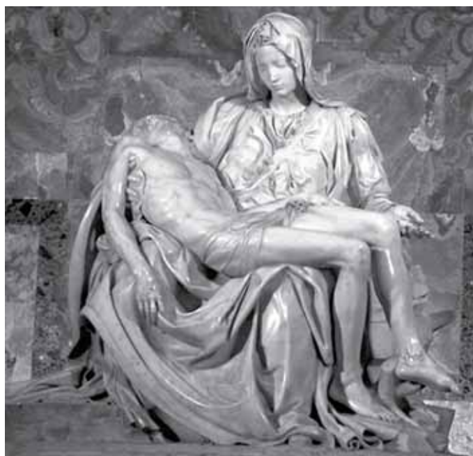
Мікеланґело Буонарроті. Пієта (оплакування Христа), мармур 1499 рік. Собор святого Петра, Рим, Ватикан.

Щонайменше 7 млн. католиків зі 170 країн, включно з сотнями єпископів і кардиналів, підписали петицію із закликом до Папи Римського проголосити Марію «духовною Матір'ю людства, співвідкупителькою разом з Ісусом-Відкупителем, посередницею у всіх молитвах до Ісуса-Спасителя і захисницею людства перед Ісусом Христом», повідомляє «NorthJersey.com».