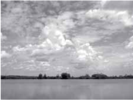
На фото: мальовничі околиці села Миклашів.

1409 рік – це перша письмово зафіксована дата про Миклашів. Запис цей зроблено у львівських міських актах. З іншого документа – нотаріального запису – відомо, що 17 серпня 1485 року львівський католицький архієпископ Ян Вонтрубка-Шшелецький повідомляє, що король Казимир IV заснував шість мансїонарій при каплиці святої Катерини і наділив пресвітерів десятиною з сіл Миклашева, Нового Села, Скнилова та Великого Поля. Архієпископ підтвердив це, ратифікував і записав на власність костелу.