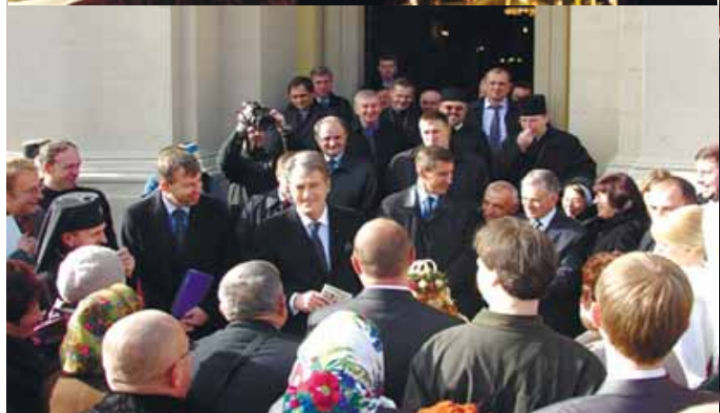
ФОТОРЕПОРТАЖ о. Паєла ДРОЗДЯКА