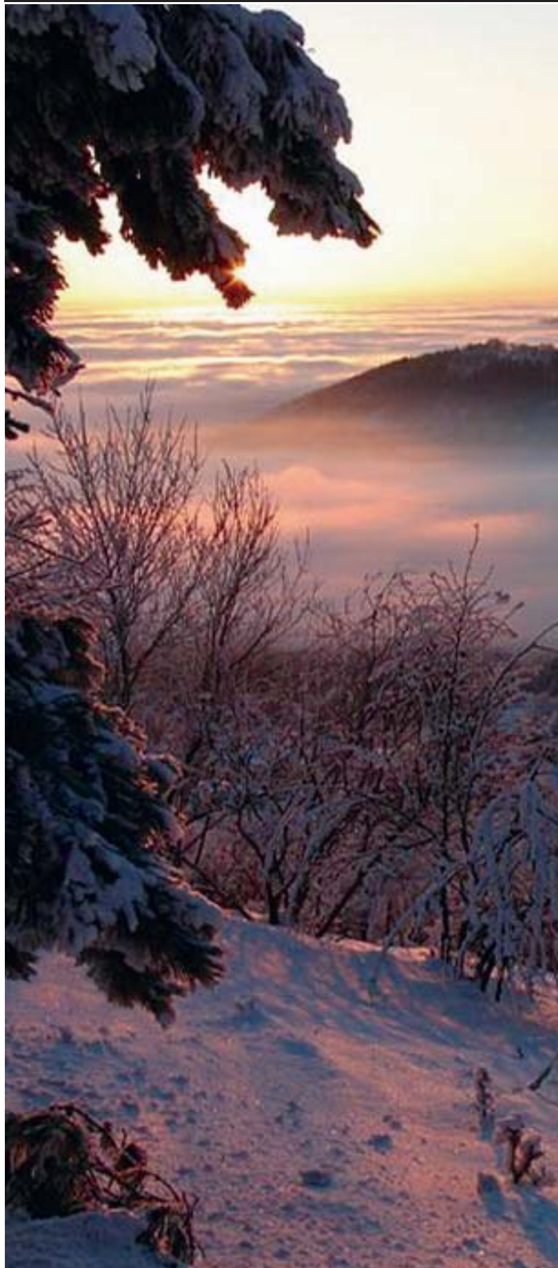
Фотоетюди Святослава ВЕРЕЩИЦІ «Святий Вечір надходить...»