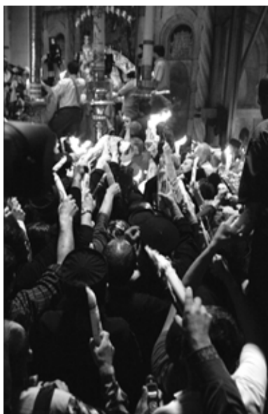
Кувуклію. Нині Патріарха оглядають єврейські поліцейські, які стежать за усім навкруги.

Свого часу, сподіваючись підловити християн на махінації, міське мусульманське начальство розставляло по всьому храмі турецьких воїнів, а ті оголювали ятагани, готові відрубати голову будь-якому, кого би побачили, як він вносить або запалює вогонь. Однак за всю історію турецького панування жодного разу ніхто в цьому так і не був викритий.