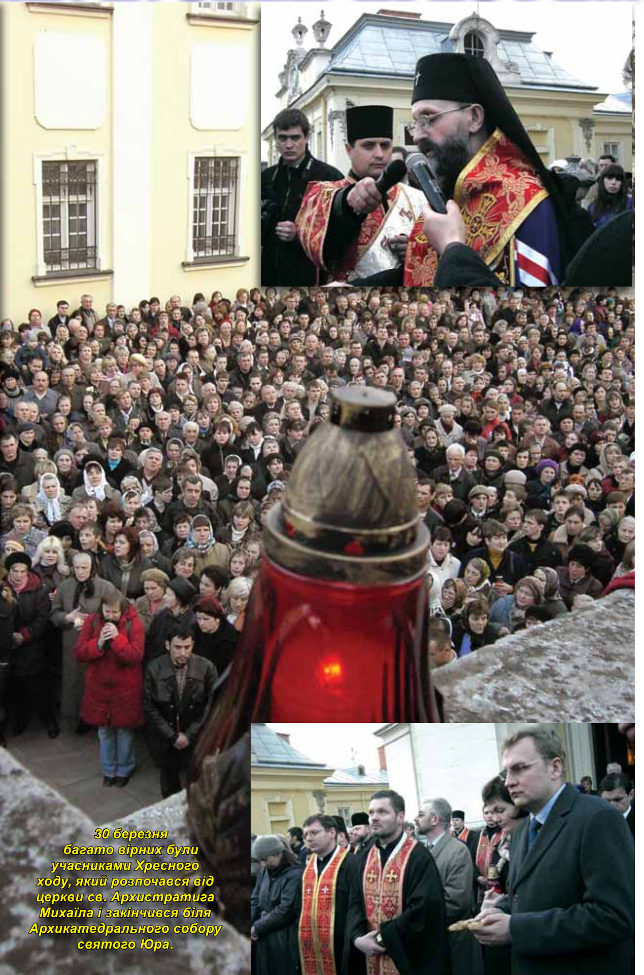
30 березня багато вірних були учасниками Хресного ходу, який розпочався від церкви св. Архистратига Михаїла і закінчився біля Архикатедрального собору святого Юра.

Завдяки Господній любові до людей християни як найбільшу святиню зберігають у себе вдома два шматки дерева у вигляді хреста.