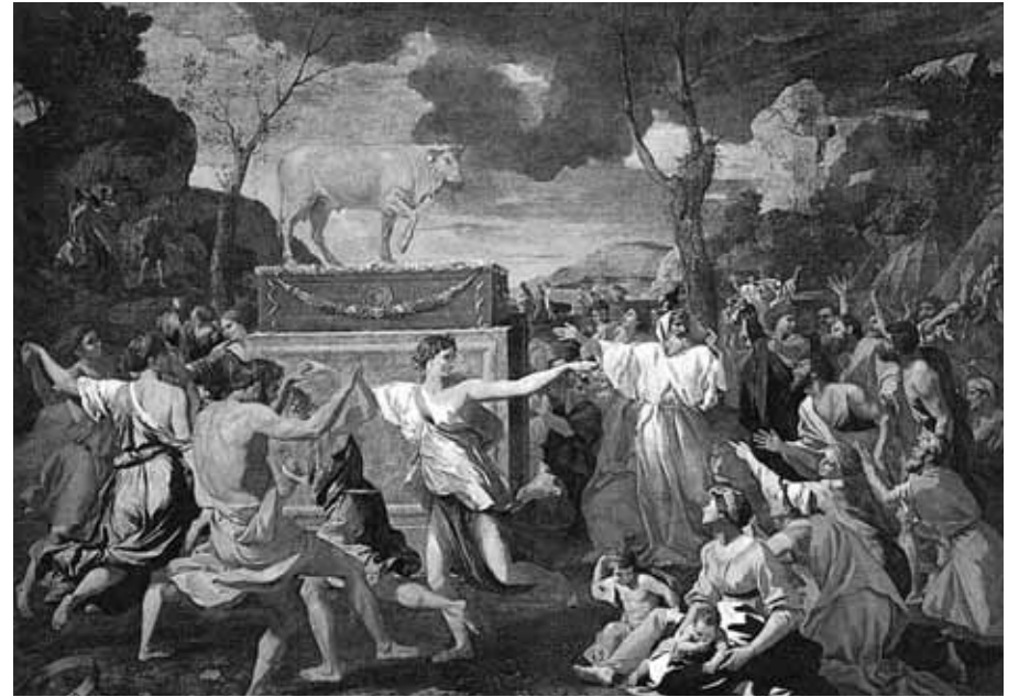
Ніколя Пуссен (Nicolas Poussin 1594-1665) «Поклоніння золотому тельцеві»

З усіх хворіб у наших часах щораз більше набуває розголосу страшна невиліковна недуга з англійською назвою ЕЙДС та українською СНІД, що значить синдром Набутого Імунітет-