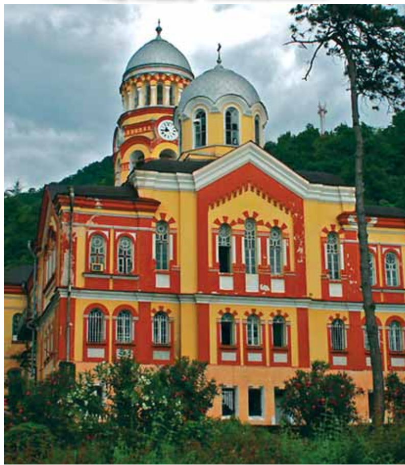
На фото: Новоафонський монастир.

Чотири уродженки Молдови випадково порушили заборону і висадилися на грецькому півострові Афон, де знаходяться 20 православних монастирів і де з 1060 року не ступала нога жінки, повідомила Російська служба ВВС. Непроханих гостей на території Афону монахи виявили недільного вечора і відразу ж викликали поліцію.