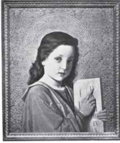
о. Юліан КАТРІЙ, «Заповіді Божі»