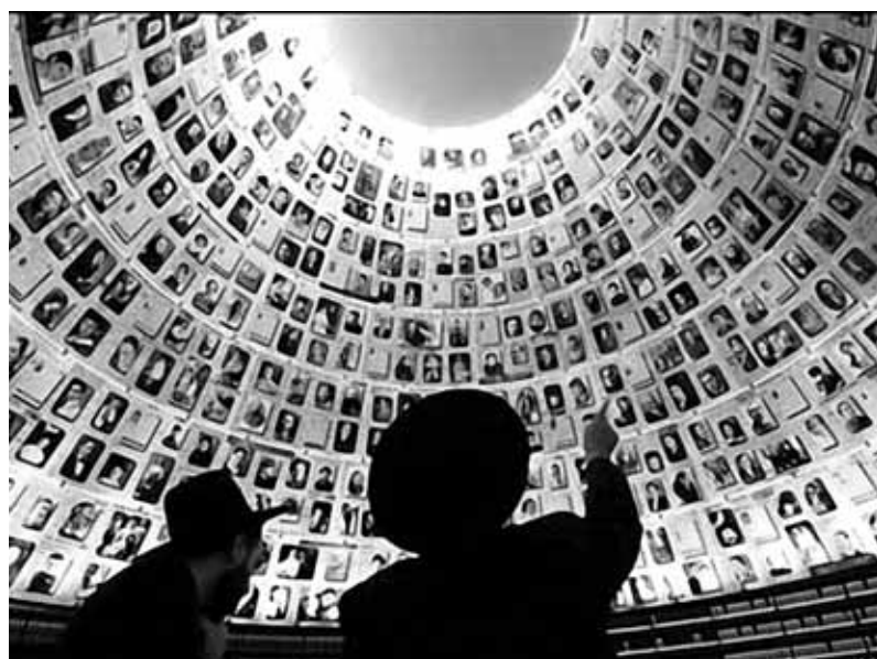
На фото: Меморіальний комплекс Яд Вашем в Ізраїлі