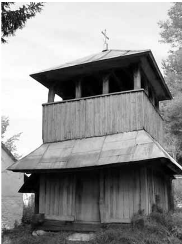
На фото: Дзвінниця церкви Стрітєння Господнього у Черепині.