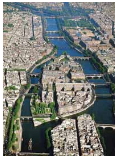
Острів Сіте – центр сучасного Парижу – був в давнину центром римського поселення Лютеції. Тут на межі V-VI вв. трудилася преп. Геновефа.

Плачеш, моя дитино? Хоч втрапиш матір, та Бог дасть