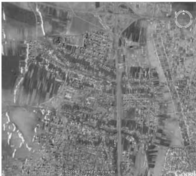
с. Солонка. Вид з супутника