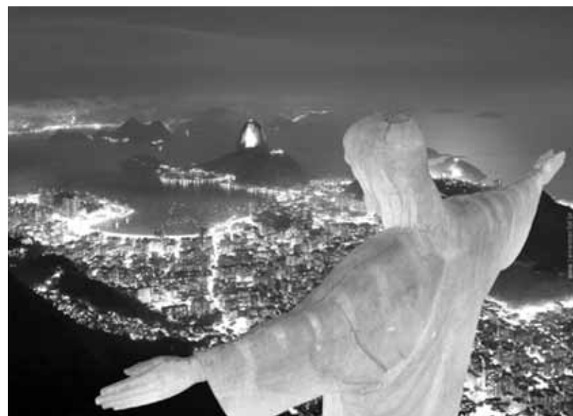
Статуя Ісуса Христа на горі Корковаду (Corcovado) в Ріо-де-Жанейро, Бразилія. Висота 38 м Споруда статуї продовжувалася близько п'яти років. Відкрита 12 жовтня 1931. Автори — Еїтор та Силва Кошта (Heitor da Silva Costa), Поль Ландовський (Paul Landowski).

У той же час душі тих, хто окутався гріховністю, стали поневолені в адовому середовищі, вийти звідкіля самотужки ніхто не був спроможний. Тіла ж їхні стали розкладені тлінню на землі.