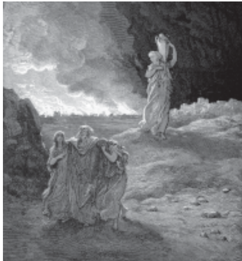
Гравюра Поля Гюстафа ДОРЕ (1832 - 1883) «Загибель Содом і Гомори».

У 1924 році археолог Вільям Олбрайт розкопав у місцевості Баб-ед-Дра біля південних берегів Мертвого моря древнє місто. Неподалік у місцевості Нумерія трохи пізніше знайшли залишки ще одного. Найцікавішим же виявився той факт, що обидва міста були зруйновані сильною пожежею, після якої мешканці так і не повернулись до них. Деякі вчені поспішили ототожнити Баб-ед-Дра із Содомом, а Нумерію – з Гоморою. Більшість же вважає, що ці розкопані міста – дійсно одні з міст околиці (Бт. 13, 12), але Содом і Гомору потрібно шукати під водами Мертвого моря. Так що пошуки Содому й Гоморипродовжуються: учені обстежують місцевість із повітря, поринають у солоні мертві води, адже бажання знайти Содом і Гомору надзвичайно велике – завдяки цікавій біблійній розповіді про знищення Богом цих міст сірчаним дощем і вогнем, через що вони стали символом кари за гріхи і розпусту.