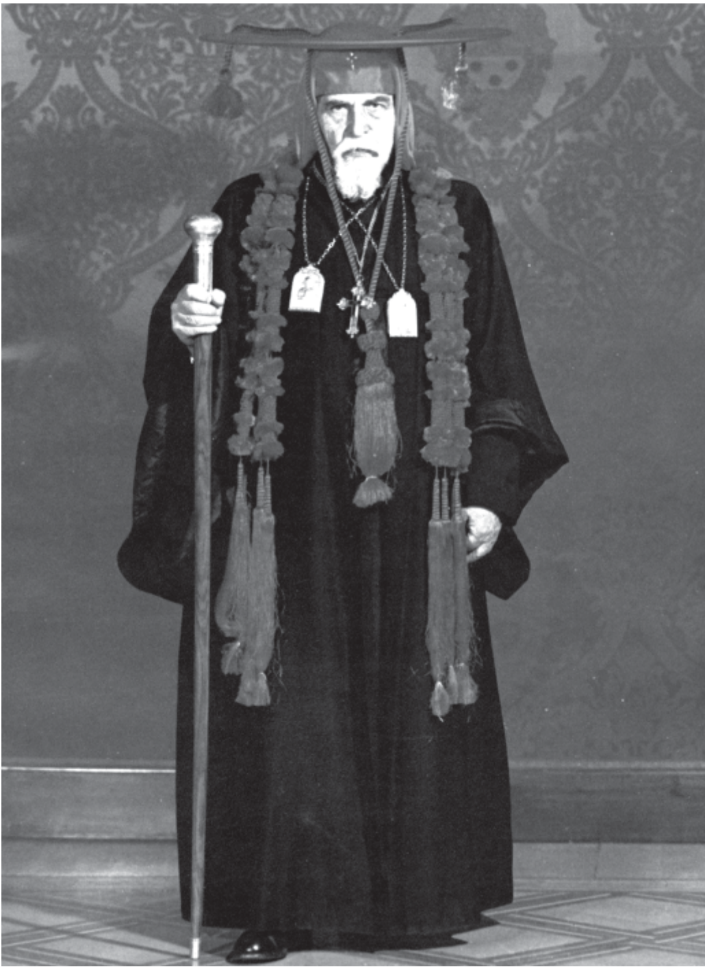
Патріарх Йосиф Сліпий у капелюсі кардинала Вселенської Церкви

Інколи людину Бог вибирає ще в колосці, наче торканням перста її чола даруючи їй долю – важку, та водночас і світлу, – долю, яка буде осяяна кожномиттєвою любов'ю до Бога та свого народу. До таких людей належить і Патріарх Йосиф Сліпий.