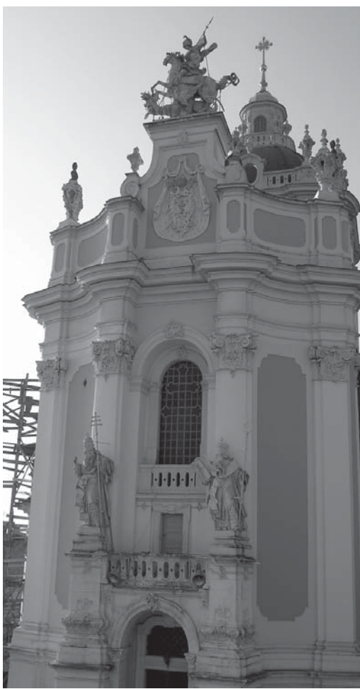
(Продовження у наступному номері)

Як і перший період існування Галицької митрополії, так і другий тривав недовго. Бурхлива доба польсько-литовсько-руської історії кінця XIV – перших десятиліть XV століття внесла свої корективи не тільки в державно-династичні конструкції на цьому геополітичному просторі, але й в церковні відносини. Тут не час і місце докладно зупинятися на всіх перипетіях політичного й церковного життя на українсько-білоруських землях, що були в той час інкорпоровані вже до складу Польської корони і Литовського князівства, а скажемо лише, що на початку XV ст. відновлена 1371 р. Галицька митрополія знову занепадає. Хоч немає окремого канонічного акту про скасування цієї, вдруге посталої митрополії, на 1415 рік вона фактично перестала існувати. Саме цього року в містечку Новгородку, що на русько-литовському пограниччі, відбувся церковний синод, на якому єпископи українсько-білоруських єпархій обрали нового київського митрополита, незалежного від Москви, – Григорія Цамблака. В цьому синоді брали участь і єпископи колишньої Галицької митрополії – володимирський Герасим, перемильський Павло, холмський Харитон. Деякі джерела подають, що був присутній також владики галицький Йоан. У кожному разі, починаючи від синоду в Новгородку 1415 року, існує вже єдина Києво-Галицька митрополія, а її предстоятелі поступово починають іменувати себе «Митрополитами Київськими і Галицькими». Цей титул пронесуть вони крізь віки – аж до початку XIX століття.