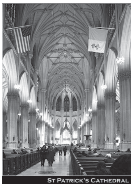
ST PATRICK'S CATHEDRAL

Нью-Йоркський філантроп вручив архидієцезіальному єпископові Нью-Йорка найбільше пожертвування – в сумі 22,5 млн. доларів. Пожертвування піде на стипендії для католицьких початкових шкіл.