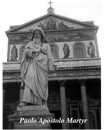
Базиліка св. Павла в Римі, де знайдено мощі святого.

Тим часом Папа Венедикт XVI розпорядився почати підготовку до святкування 2000-річчя від дня народження святого апостола Павла.