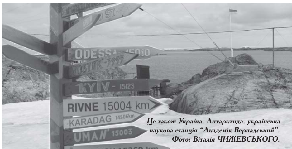
Це також Україна. Антарктида, українська наукова станція "Академік Вернадський".