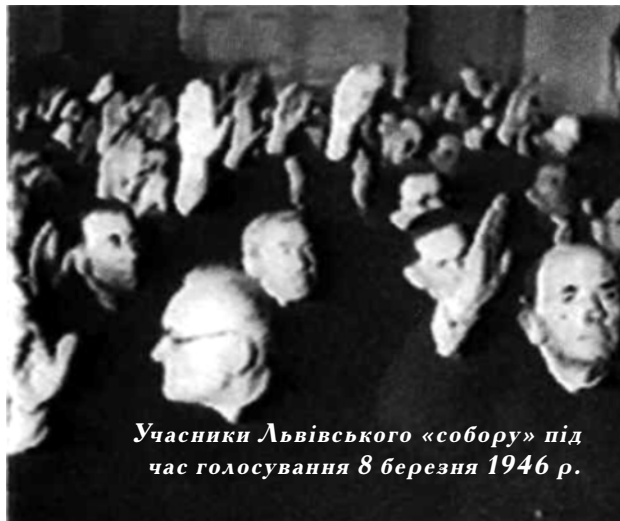
Учасники Львівського «собору» під час голосування 8 березня 1946 р.

лося розуміння людських прав і особиста свобода совісті була визнана найвищою цінністю, в Союзі Радянських Соціалістичних Республік у 1946 році відбувся акт, якого б у Польсько-Литовській державі