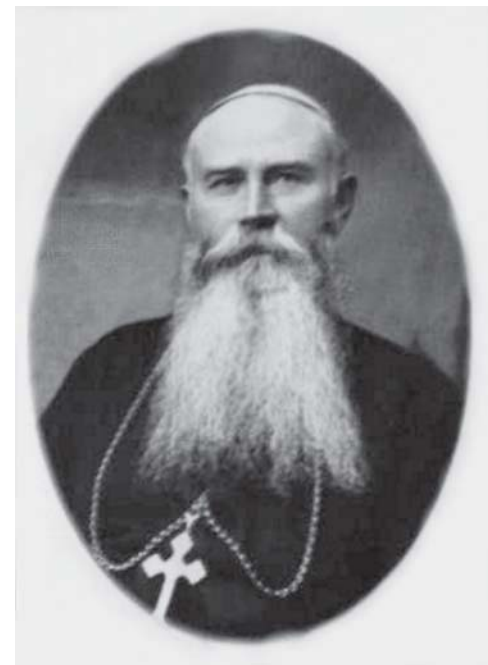
Перемиський єпископ-ординарій Йосафат (Коциловський)

Єпископів у таборах утримували разом із політичними й карними злочинцями. У вересні 1946 року митрополит Йосиф етапом через Новосибірськ прибув до Марійського табору Кемеров-