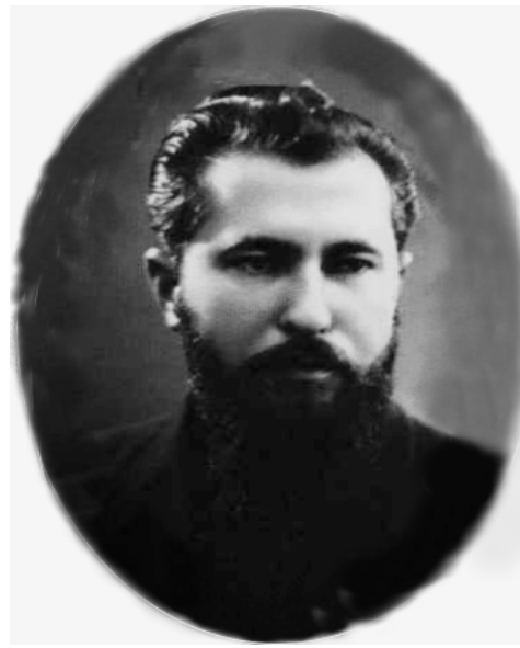
Єпископ-адміністратор Мукачівської єпархії Теодор (Ромжа)

Під час ув'язнення о. Величковський таємно здійснював свої священні обов'язки, проводив місійну працю. Як і багатьма іншими ув'язненими греко-