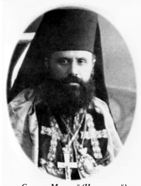
Єпископ Миколай (Чарнецький), апостольський візитатор для Волині, Полісся і Підляшшя

було засуджено на вісім років за подібним звинуваченням, – незважаючи