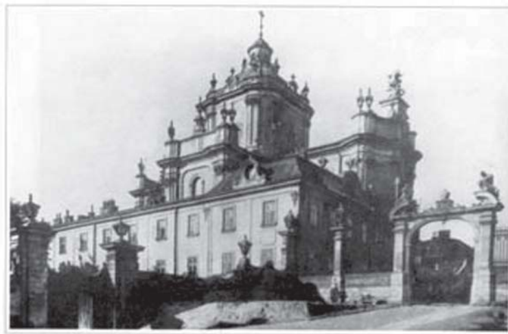
Архикафедральный греко-католический собор Св. Юра у Львові.

Созыв, охрану, питание и, конечно, содержание мероприятия, вошедшего в историю под названием «Львовский собор 1946 г.», — все обеспечили органы госбезопасности. Площадь перед собо-