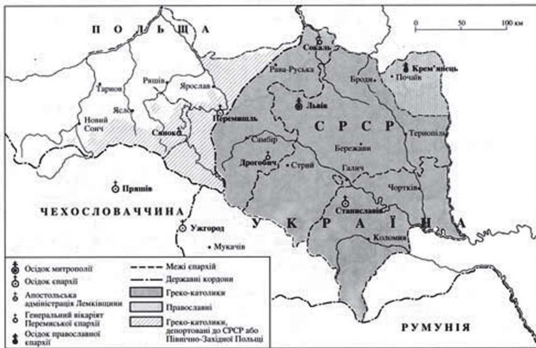
УКРАЇНСЬКА ГРЕКО-КАТОЛИЦЬКА ЦЕРКВА ПЕРЕД КВІТНЕМ 1945 РОКУ