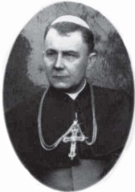
Станіславівський єпископ-ординарій Григорій (Хомішин)

Владика Микита (Будка) помер 1 жовтня 1949 року в Казахстані в таборі поблизу Караганди, маючи 72 роки. Після півторарічного ув'язнення в Лук'янівській тюрмі єпископа Івана (Лятишевського) було відправлено етапом до табору біля Мерке, а потім – у Чулак-Тау Джамбульської області в Казахстані. Отця Петра Вергуна, якого тримали в ув'язненні в Боїмах та Інті разом із єпископом Миколаєм і митрополитом Йосифом, було вислано на поселення до селища Ангарське Богучанського району Красно-