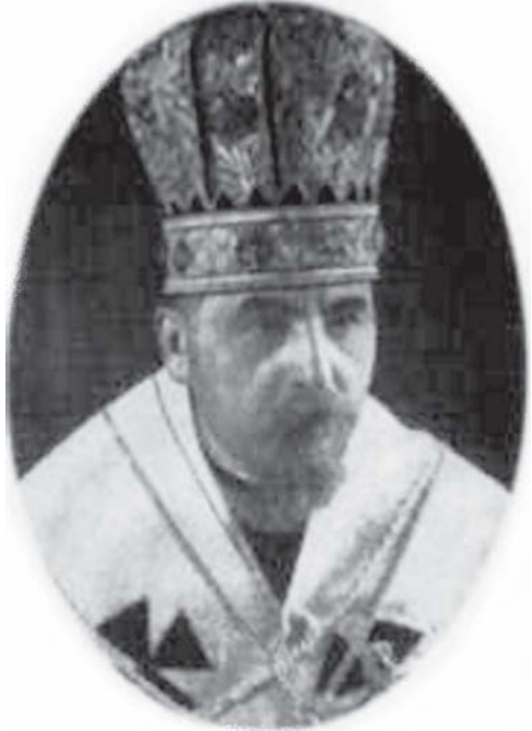
Митрополит Йосиф Сліпий

Заарештованих єпископів, найбільш активних священників і монахів тримали окремо один від одного в київській тюрмі НКДБ/МДБ. Понад рік тягнулося слідство