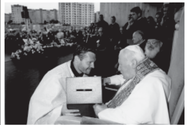
ЗІ СЛОВА ПРО УКРАЇНУ БЛ. П. ІВАНА ПАВЛА II