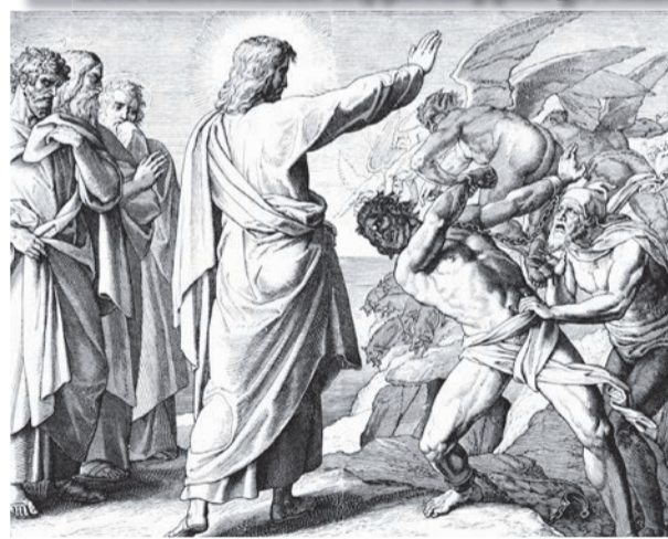
Німецький графік романтичного напрямку Юліус Шнорр фон Карольсфельд (1794-1872) «Ісус виганяє бісів»

Питання: У релігійній літературі можна знайти багато імен ангелів і демонів, служителів Сатани. Наприклад, «Люцифер», «Вельзевул». Це один і той самий демон, чи різні?