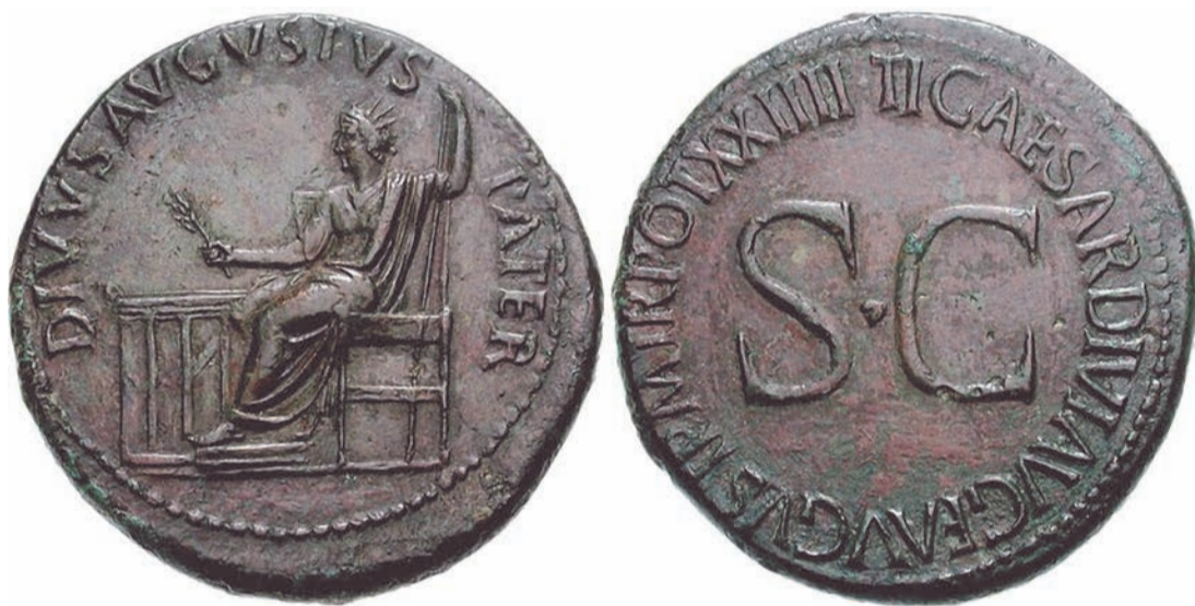
Подібний динарій провокаційно показували Ісусові Христові фарисей. А Він каже до них: Чий це образ і напис? (Мт. 22, 20) Ті відказують: Кесарів. Тоді каже Він їм: Тож віддайте кесареви кесареві, а Богові Боже (Мт 22,21). На монеті зображено імператора Тиберія, який в той час правив Римською імперією, про що свідчить напис латиною: «Tiberius Caesaris Divi Augusti Filius Augustus Pontifex Maximus» («Тиберій Цезар, син божественного Августа; Август, верховний понтифік»).

Також всім тим, які говорять, що всяка влада від Бога і пропагують культ царя як Божого помазанника, варто прочитати 8 главу I книги Самуїла. Йдеться про те, що Ізраїль забажав собі царя, як і інші навколишні народи (див. 1 Сам 8, 4-7) Тобто бажання