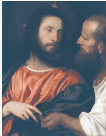
«Динарій кесаря» - відома картина великого італійського художника Тіціана, написана ним близько 1516 року

Ті, хто покликується на слова: «Всяка влада від Бога», спираються на слова із Святого Письма – 13 главу послання до Римлян св. Апостола Павла: «Нехай кожна людина кориться вищій владі, бо немає влади, як не