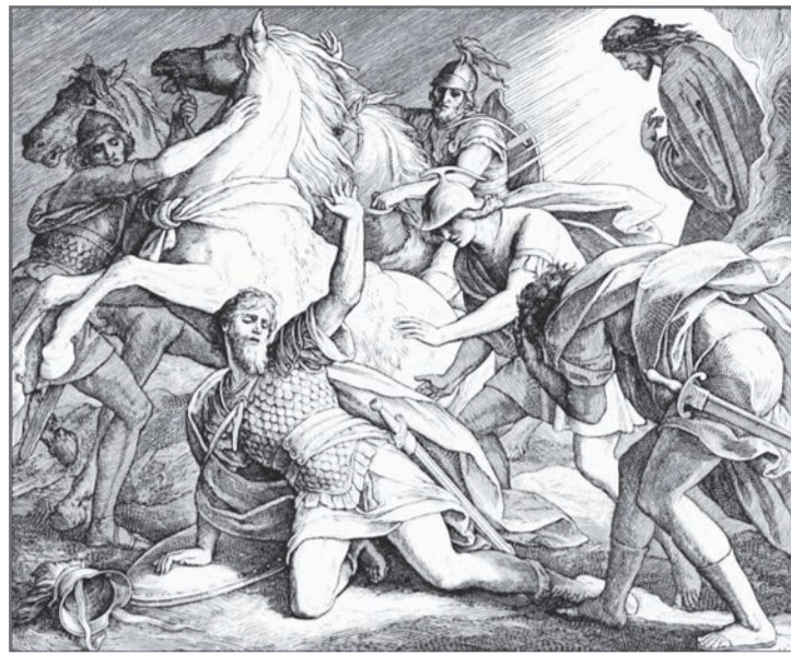
Навернення Савла. Худ. Юліус Шнорр фон Карольсфельд (1794—1872)

У цьому місці слід нагадати, що євреї – це не легковірний народ. Досить почитати історію Виходу з Єгипту, пророчі книги або ті ж Євангелія, аби переконатися, що у кожного єврея завжди є своя думка про те, як Бог повинен його рятувати. Та й самі апостоли не особливо вірили в слова Ісуса про Його майбутнє страждання і Воскресіння. Навіть Симон, названий Петром через свою міцну віру, намагався відрадити Ісуса, коли той почав говорити про Свою страту (див. Мт. 16, 21-23). Єврей завжди ставить питання, часто навіть відповідає питанням на питання. За часів Ісуса в арамейській мові існувало близько 30 синонімів слова «питання». Тому ми можемо бути впевнені в тому, що апостолів просто засипали питаннями. А величезна кількість тих, що увірували, свідчить про те, що жодне питання не залишилося без відповіді, а факти підтверджували особисте свідчення тих, котрі бачили Ісуса воскреслим.