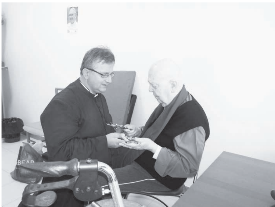
На фото о. Габріеле Аморт розповідає ксьондзу Ярославу Целецькому про тонкощі «мистецтва» екзорциста.

У розумінні сучасних фахівців з боротьби з нечистою силою екзорцист – це священник, який з благословення єпископа уповноважений виганяти бісів. А таких бісів, виявляється, немало. За даними італійської газети «Liberazione», в період з 1986 по 2007 рік о. Габріеле Аморт провів близько 70 тис. обрядів екзорцизму. Сам о. Аморт в бесіді зі співробітником британської газети «Sunday Telegraph» визнав, що, починаючи з 2000 року, в його активі випадків вигнання бісів дещо менше – 50 тис. Як правило, екзорцист