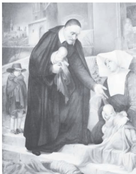
Св. Вікентій де Поль

Завершився відпуст благословенням Митрополита, а відтак прочани мали можливість помолитися та випросити ласки перед чудотворним образом Розп'яття Христового.