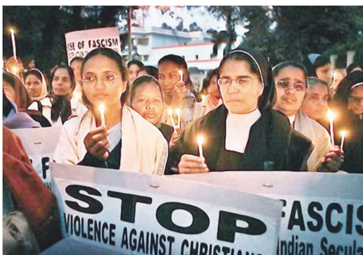
Написи на банерах, які тримають сестри «Зупинити насильство і фашизм щодо християн»

Перша зі згаданих тут країн на практиці є єдиною повністю атеїстичною державою у світі,