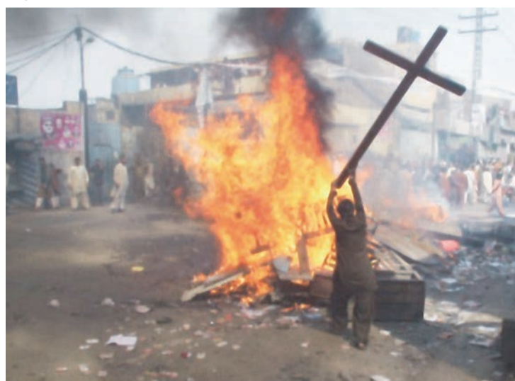
Напад на християн у Лахорі (Пакистан)

Яскравим прикладом браку релігійної свободи є саудівська монархія, яка, вважаючи себе хранителькою святих місць ісламу, оскільки на її території знаходяться головні святилища цієї релігії – Мекка і Медіна, а також камінь Кааба – не дозволяє існувати на своїй території жодній іншій релігії, навіть якщо визнають її лише іноземці. А за перехід з ісламу в іншу віру, наприклад, християнство, загрожує смерть. Подібно, хоч, може, поки що не такі жорсткі положення зобов'язують у більшості інших ісламських країн, а якщо навіть хтось із них дозволить побудувати католицької святині (наприклад, у березні минулого року в Катарі), то – щоб не