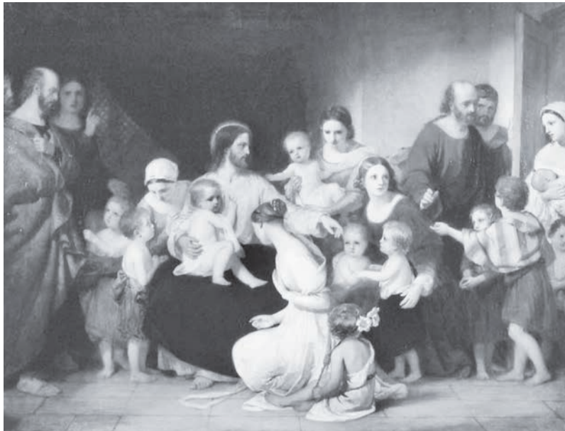
Британський художник Чарльз Локк Істлейк (1793-1865) «Христос благославляє маленьких дітей».

Менш юридичний підхід дозволив також переосмислити долю усіх неохрищених. Церква почала дивитися на людство як на кола, з якими веде діалог. Наприклад, неохрищеними є євреї, але чи вони будуть у пеклі? Важко погодитися з