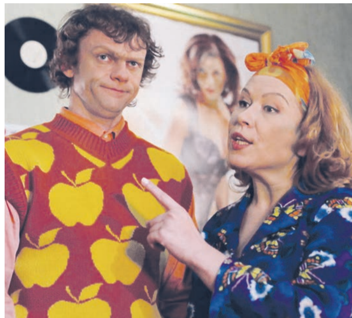
Мама Віталіки з відомого українського телесеріалу на каналі ТЕТ: Я - золота свекруха, але тільки для платинової невістки

свекрухою. Ось так, мимоволі, я стала свідком життєвих проблем, які викликали повільний розпад її подружжя.