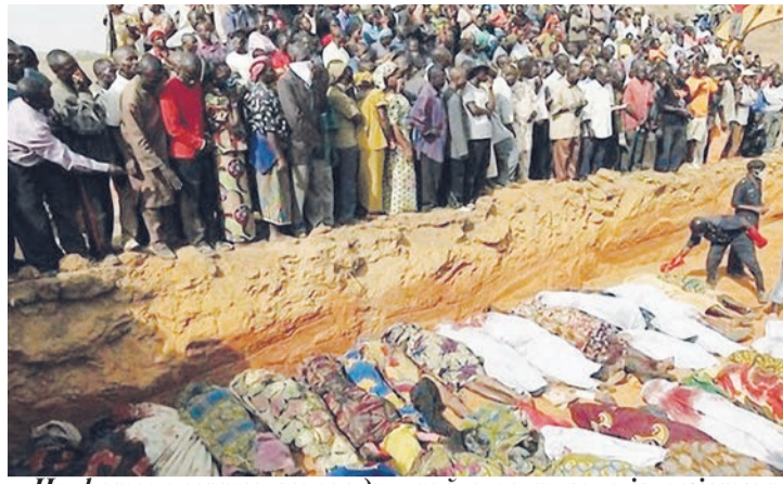
На фото: жертви геноциду, який влаштувало ісламістське угруповання Boko Haram проти християн у Нігерії

Але не тільки іслам, особливо фундаменталістський, становить загрозу для свободи релігії. За багато років дуже тривожні звістки надходять також з Індії, де більшість мешканців визнають індуїзм. Ця релігія, яка впродовж десятиріч асоціювалася людьми Заходу з толерантністю, або зі спокоєм і незастосуванням насилля, сьогодні все частіше пов'язана з кровопролитними нападами на християн, яких індуїстські екстремісти звинувачують у наверненні індуїзму. Про ворожість деяких фундаменталістів