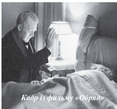
Кадр із фільму «Обряд»