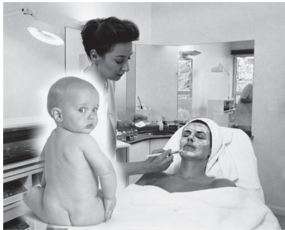
«...а чи не з мого братика Ваш живильний крем?..»

Мамо, чому моє серце стискається від тривоги: куди ти несеш мене? Я бачу кімнату, повну чорних демонів. Я хочу бігти, але я впійманий, як звір у сітці: чудовисько в образі людини хоче мене вбити. У мене відтинають руку. Мамо, тобі, напевно, ніколи не відтирали руки, і ти не знаєш, як це боляче, інакше ти не дала б цій людині так мучити мене. Мамусю, тобі ніколи не розривали голови, а залізні кліщі схопили мою голівку й трощать