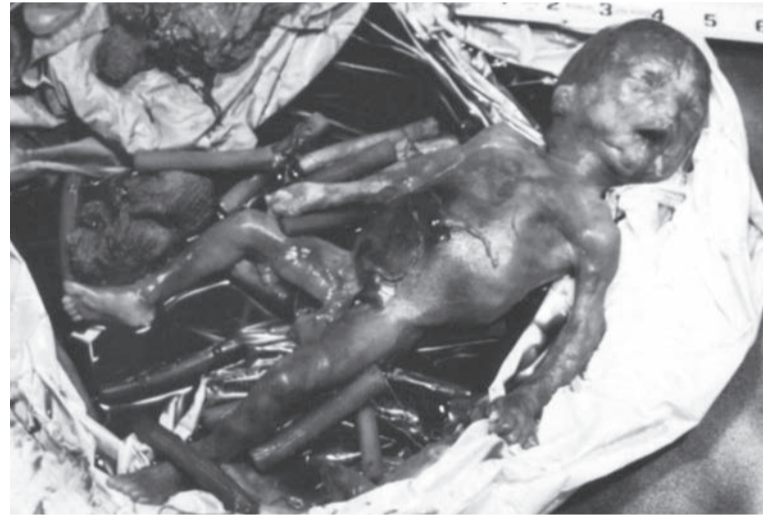
Після аборт. Божжа подоба у відрі для сміття.

Зміна частоти серцевих скорочень і рухів плода також свідчить про те, що